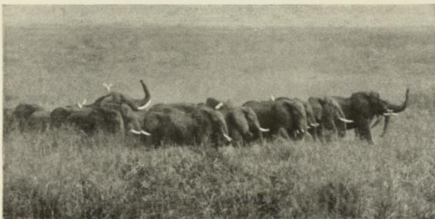
Die Phalanx der Elefanten

Illustrierte Prospekte stehen zur planmäßigen Verteilung gern zur Verfügung.