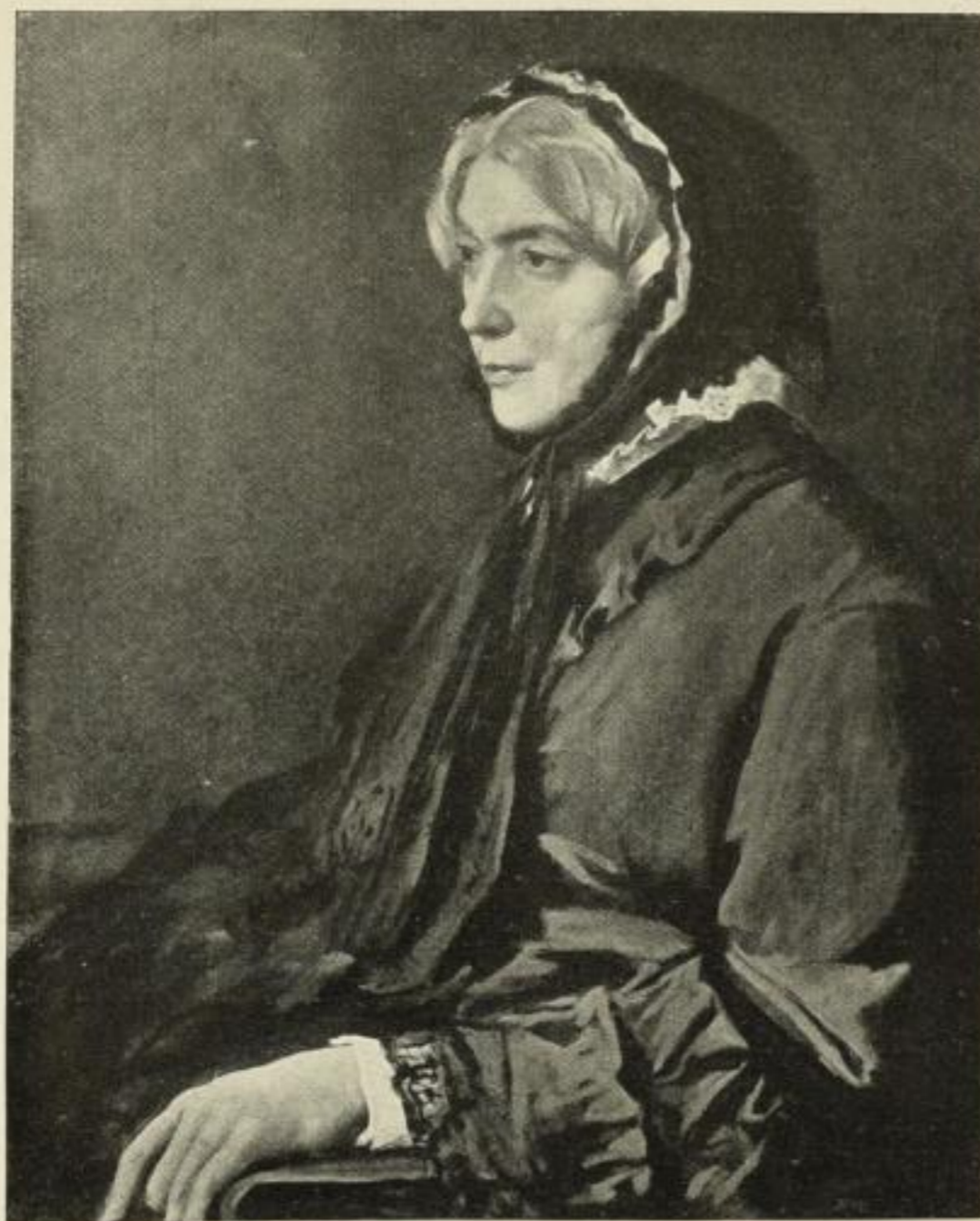
Anselm Feuerbach: Bildnis der Mutter

Neue Auflagen sämtlich auf gutem, holzfreiem Friedenspapier neu gedruckt und in Ganzleinen gebunden.