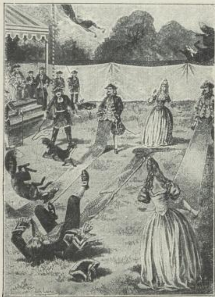
Verkl. Probe-Abbild. aus Bd. III: Vom deutschen Weidwerk