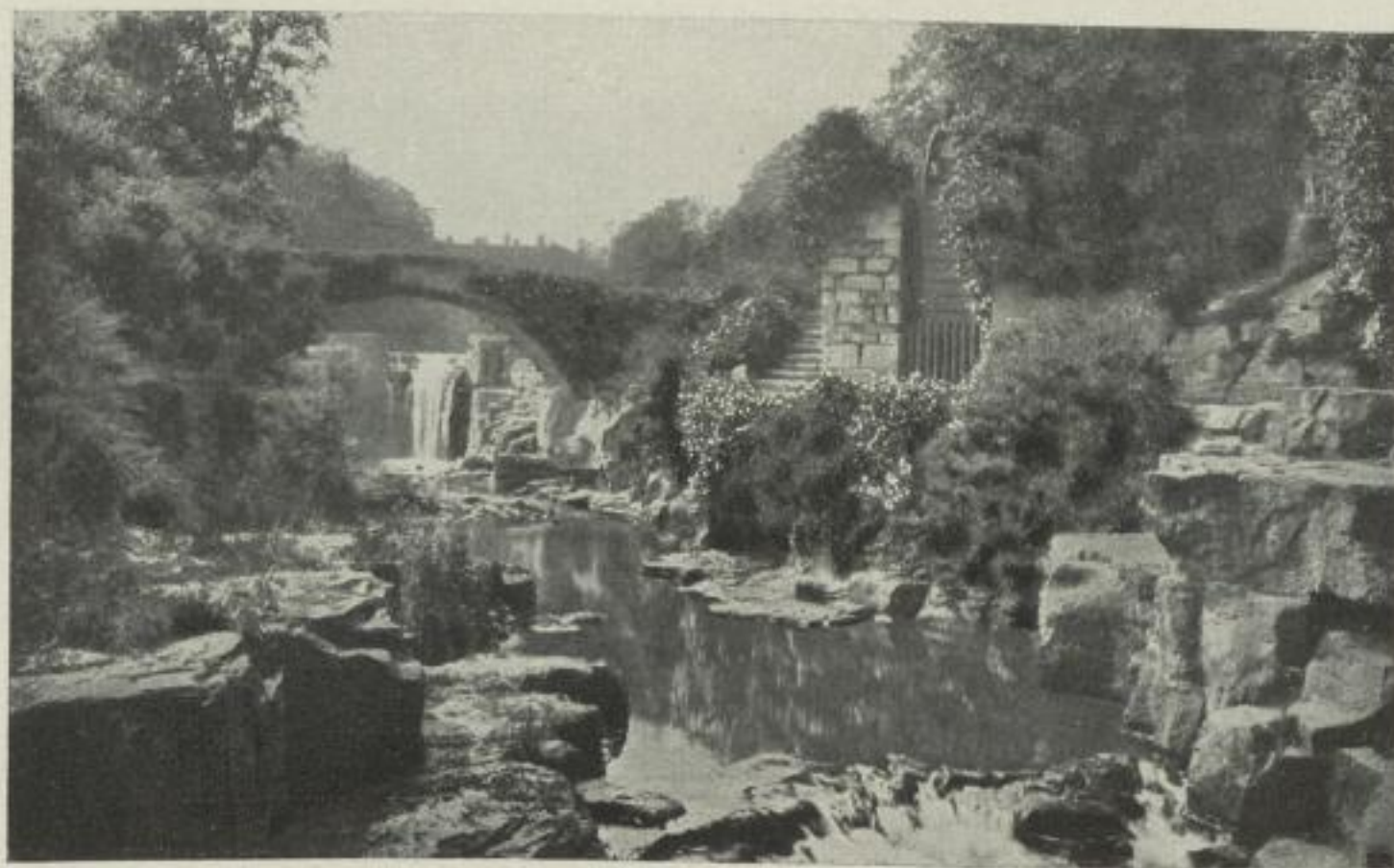
Abbildung aus Bd. IV. Heimatschutz von Ernst Rudorff.

Die Liebe zur Natur ist der gewaltige Damm, den wir dem Materialismus unserer Zeit entgegensetzen können. In allen Kreisen des deutschen Volkes diese Liebe zu erwecken und alle Kreise zum Schutze der vorhandenen Naturschönheiten zu begeistern, ist das Ziel dieser Bücherei. In allen Bänden wird das Leben und die Wirklichkeit selbst — unterhaltend und belehrend — in den Dienst der Sache gestellt. Keine graue Theorie und Vorschriften enthalten diese Werke, sondern frische Schilderungen, die aus sich die Freude an der Natur mit