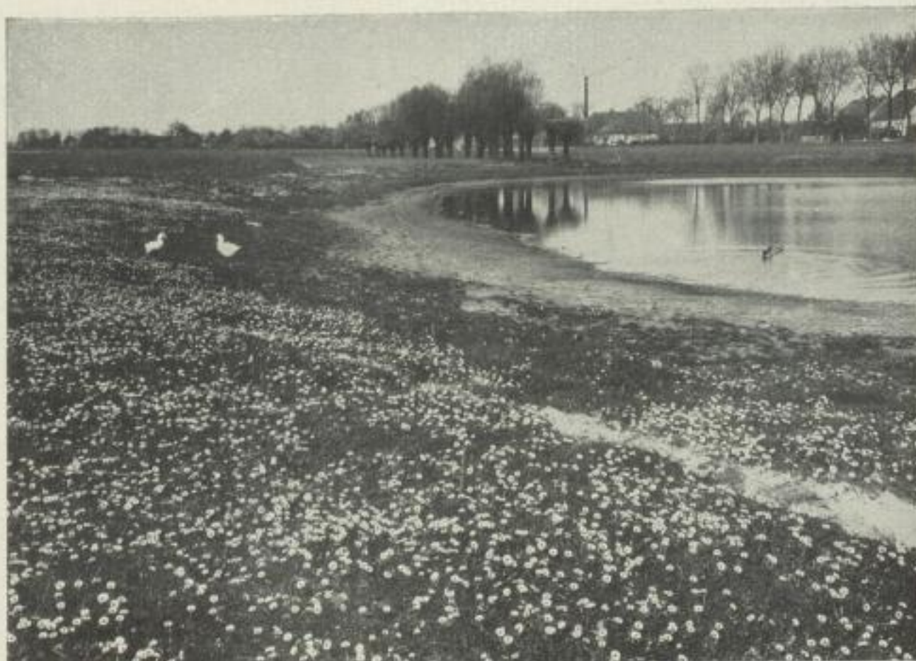
Probe-Abbildung aus: Märkisches Land...

Mit 174 Abbildungen auf Kunstdruck-Tafeln Preis in blauem Künstlerleinen geb. Rm. 6.—