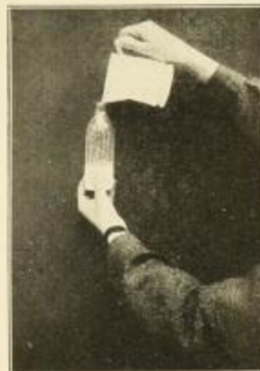
Mischen der Milch