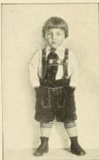
Gut entwickelter Knabe, 2 Jahre alt Zweckmäßige Kleidung für Knaben