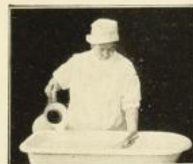
Bad, Prüfen der Wärme des Wassers

Interessenten beider Werke sind: Volksschulen, Weibliche Fortbildungs- und Fachschulen, Frauenarbeitsschulen, Mädcheninstitute, Höhere Töchter Schulen, Kinderkliniken und Krankenhäuser, Wohlfahrts- u. Jugendämter, Kinderärzte, Kinderpflegerinnen, alle Mütter und die es werden wollen, alle Landes- und Bezirksverbände für Säuglingsfürsorge.