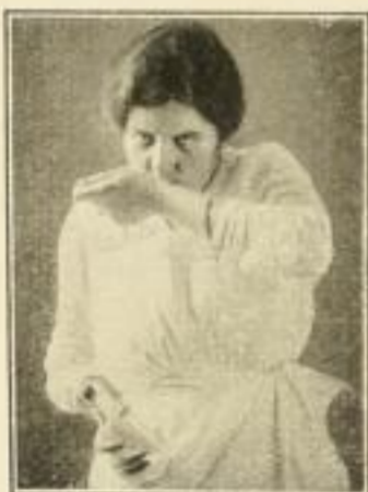
Richtiges Prüfen der Milch auf der Hand

Ein Beweis für die Vortrefflichkeit beider Werke.