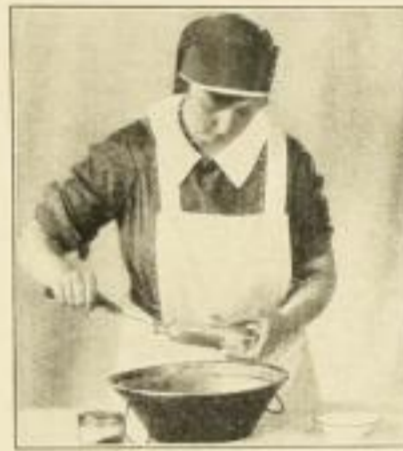
Reinigen der Flasche