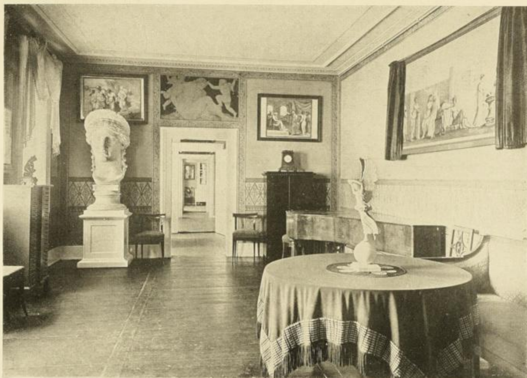
Juno-Zimmer im Weimarer Goethe-Haus