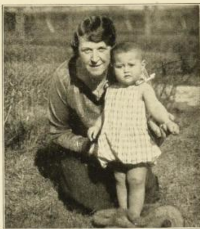
Luftbad in der Frühlingssonne Praktisches Spielhöschen für Knaben und Mädchen, auch als Luftbadhöschen geeignet