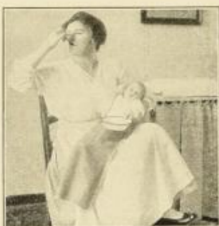
Wie der Brei nicht versucht werden darf