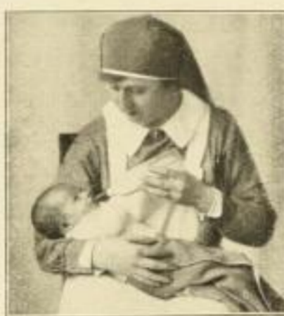
Richtiges Geben der Flasche