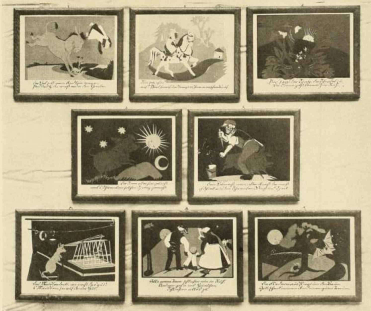
Einzelbilder aus der Mappe „Guck heraus heißt mein Haus“ in Wechselrahmen, die durch jede Buchhandlung zu beziehen sind.