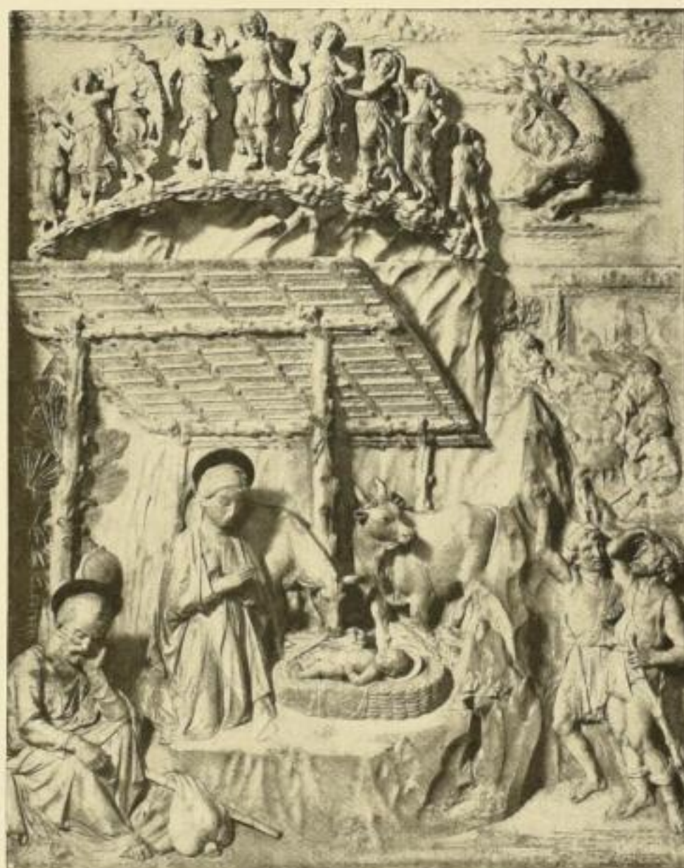
Aus: Arnold Meyer, Weihnachtsfest Abb. 6