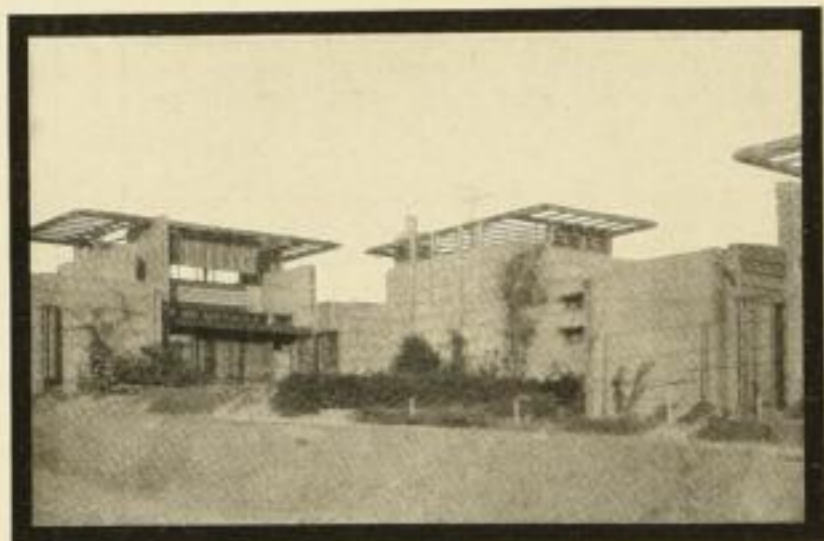
Einheitliche Hausgruppe, in Beton mit Gleitverschalung erbaut