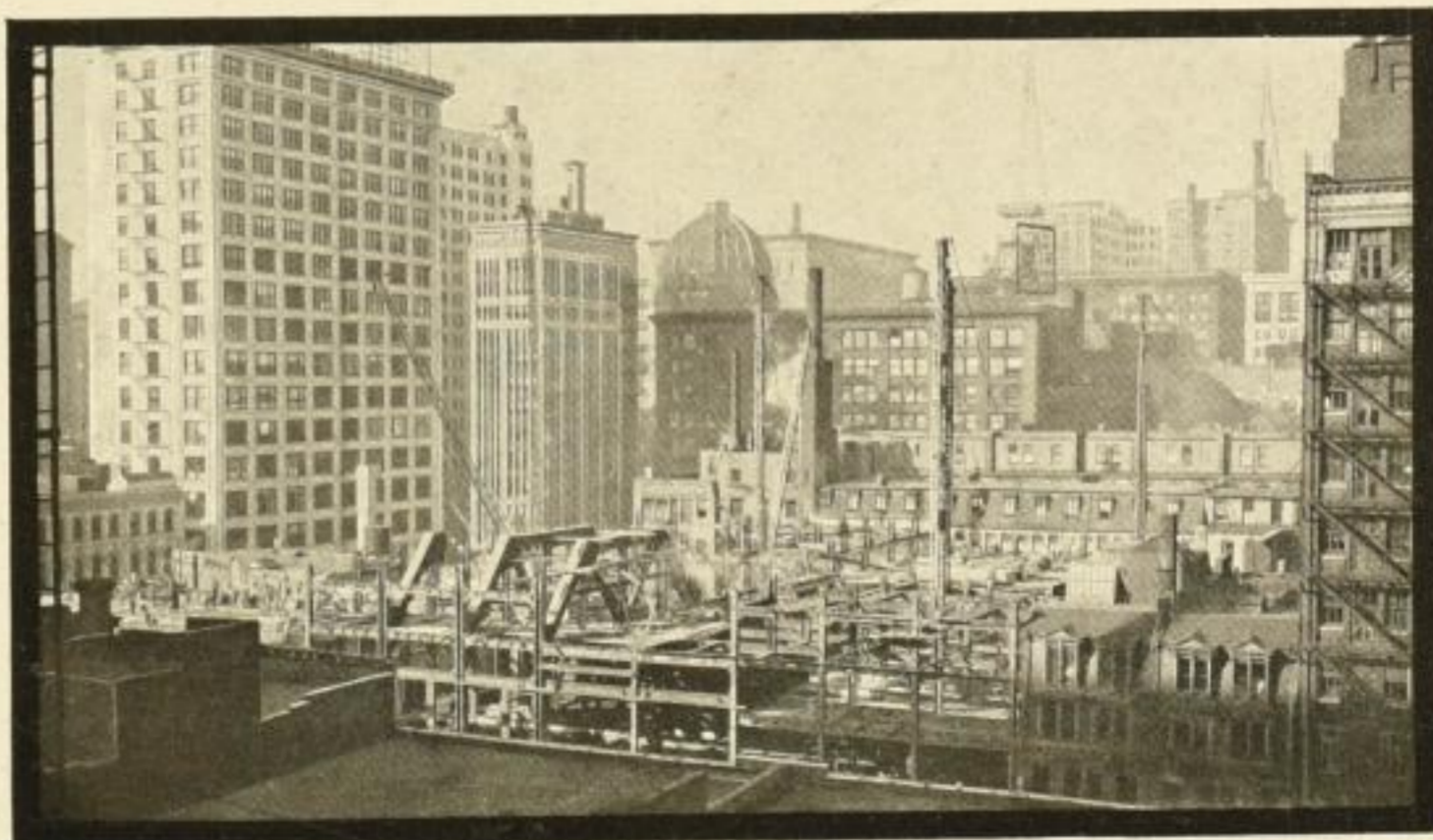
Palmerhouse, Chicago 1923—27. Das Emporwachsen der riesigen Skelettkonstruktion dieses Großhotels wird in allen Phasen erläutert und gezeigt. Grundrisse, Photos und Text erläutern dies Musterbeispiel einer riesigen Bauaufgabe