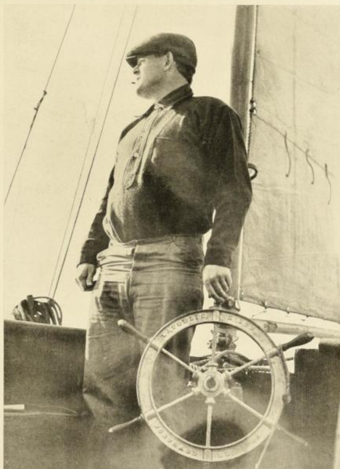
Jack London am Steuer seiner Segelyacht

Broschiert M. 5.50 / In Leinen M. 5.50 / In Halbleder M. 7.50