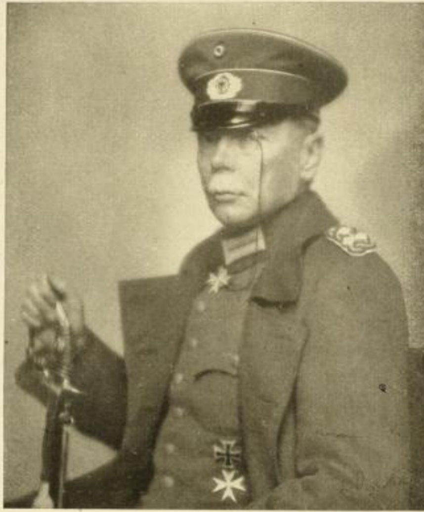
v. Seecht, Generaloberst

ist heute jedem guten Deutschen mehr wert als alles Parteigezänk und innerer Zwist! Herr Generaloberst v. Seecht hat sich für obiges Porträt eigens für unsern Verlag aufnehmen lassen. Die Ausführung des Bildes ist in erstklassigem Kupfertiefdruck mit Faksimile-Unterschrift ausgeführt. Das Format des Bildes ist: Das Bildnis selbst 22\frac{1}{2} \times 27 cm, der äußere Kartonrand 35 \times 47 cm.