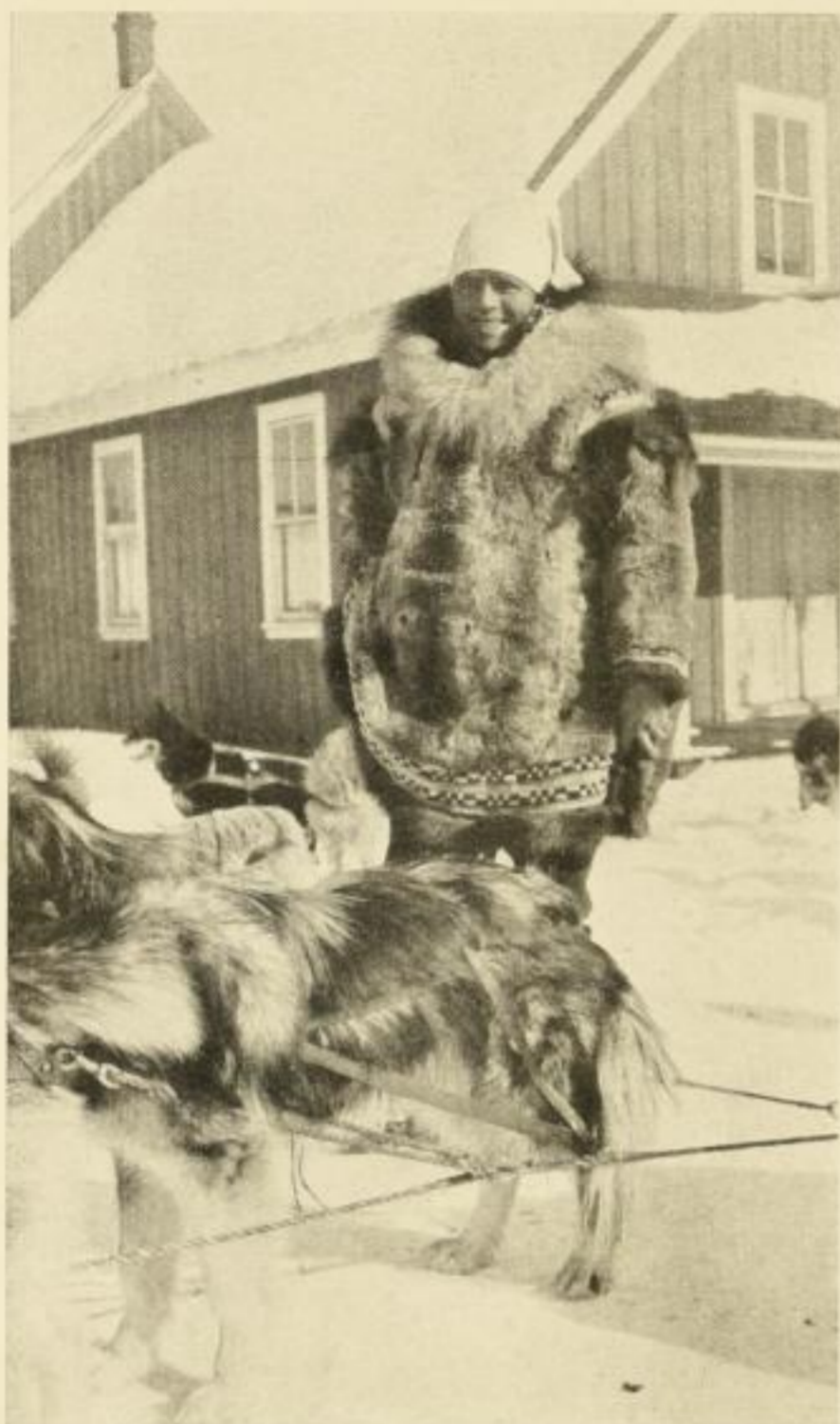
Jack London in den Goldfeldern Alaskas