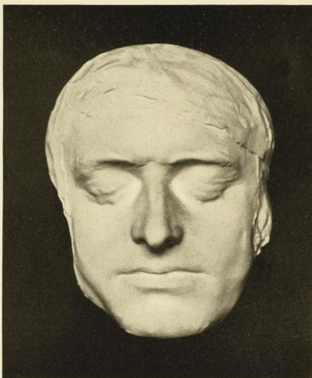
Heinrich von Kleist