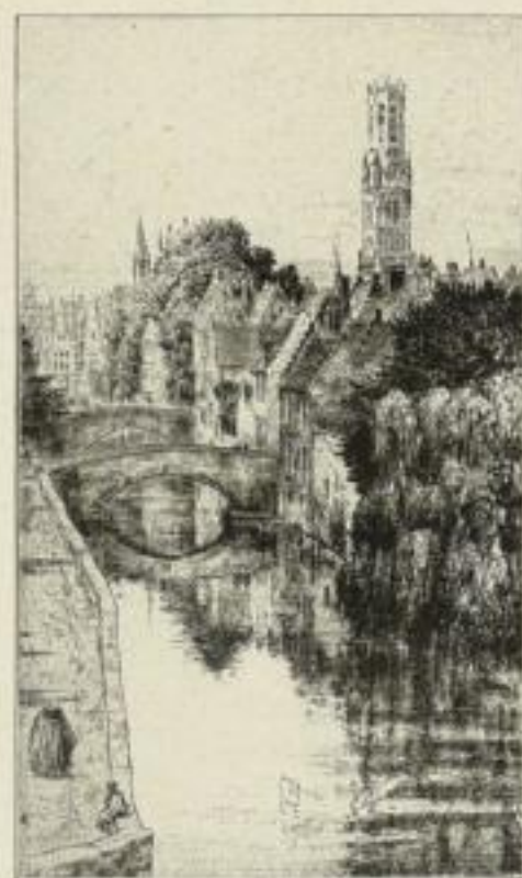
Am Groene Reij in Brügge

Verzeichnis der Blätter: 1. St. Ulrichsburg bei Rappoltsweiler / 2. Giersberg am Abend / 3. Hunaweier (Abziehendes Gewitter, Blick auf die drei Rappoltsweiler Schlösser) / 4. Zellenberg / 5. Dolder in Reichenweier / 6. Blick ins Tal der „Drei Städt“ (Kienzheim, Ammerschweier und Kaysersberg) / 7. Kaysersberg / 8. Obertor in Ammerschweier / 9. Schelmenturm in Ammerschweier / 10. Türkheim / 11. Münsterportal in Colmar / 12. Colmar, Am Münsterplatz / 13. Schädelgasse in Colmar / 14. Langgasse in Colmar / 15. Johanniterhaus in Colmar / 16. Egisheim / 17. Drei Exen bei Egisheim / 18. Rufach / 19. Gebweiler, Türme von St. Leodegar / 20. Abtei Murbach 21. Auf dem Kirchhof zu Hartmannsweiler 22. Uffholz / 23. Vogesen bei Sennheim (Molkenrain am Hartmannsweiler Kopf) 24. Sennheim, Vor dem Thanner Tor 25. Thanner Tor in Sennheim / 26. Markttag in Thann / 27. St. Theobald in Thann 28. In der Kirche von Ottmarsheim 29. Bauernhaus im Sundgau / 30. Am Rhein bei Hüningen.