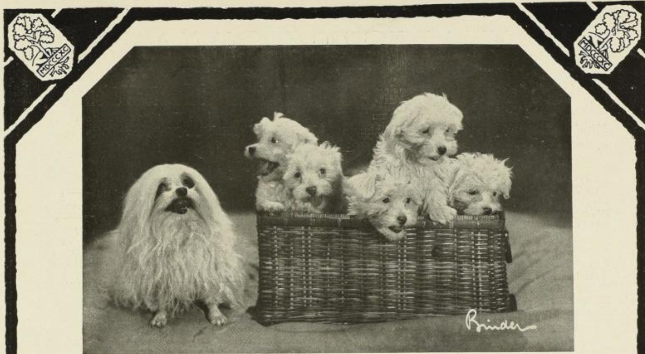
Verkleinert aus Deutscher Camera-Almanach, Band 17