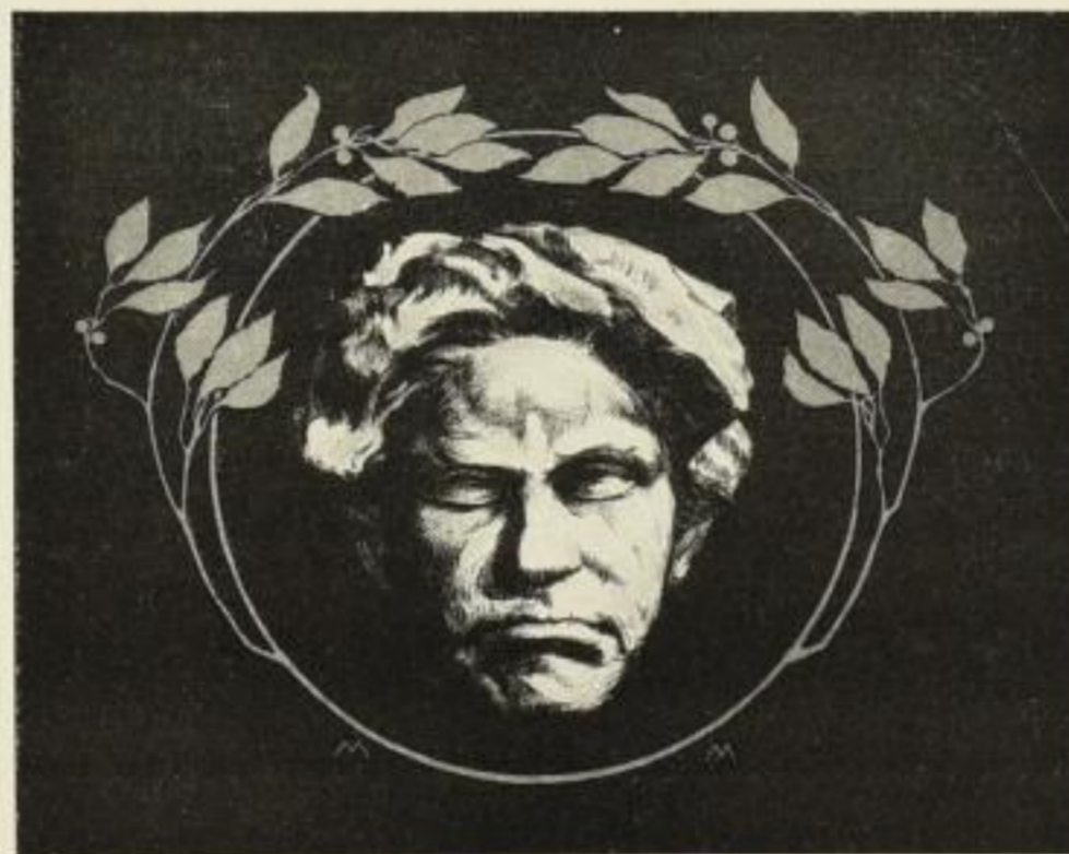
Beethovenkopf von Professor M. Molitor (nach Klinger) Steindruck schwarz-gold

Bildformat 41×52 cm, Papierformat 48×64 cm. M. 3.—