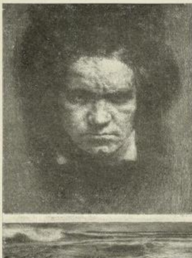
Ernst Pickardt, Beethoven Original-Radierung 30,5:23 cm, M. 20.- ord.

In Vorbereitung: FARBENLICHTDRUCK BEETHOVEN, Bildgr. 51:38 cm, M. 10.- ord.