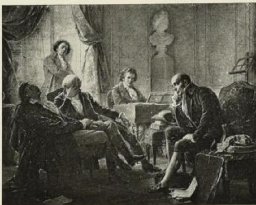
A. Gräffe Die Intimen bei Beethoven Aquarell-Druck 52:67 cm RM. 30.- Gravüre: Normal 54:70 cm RM. 25.- Imp. 41:52 cm RM. 15.- Folio RM. 4.- Kabinett RM. 1,50