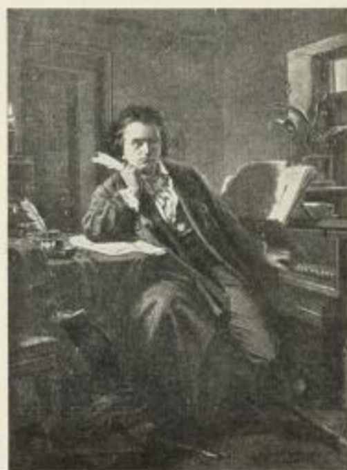
H. Junker P. K. 273 Gravüre: Imperial RM. 15.- Folio RM. 4.- Kabinett RM. 1,50