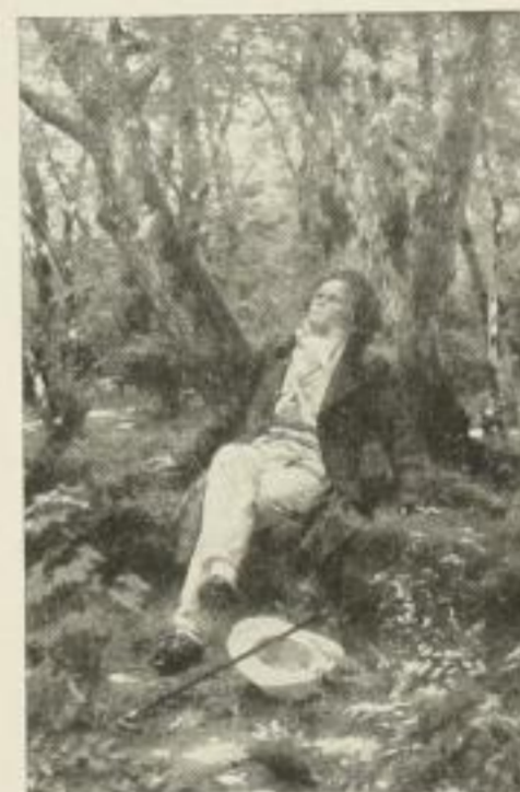
J. Schmid 11268 Aquarell-Druck 31:21 cm RM. 4.- Handaquarell 55:37 cm RM. 25.- Gravüre: Imp., Royal, Folio, Kub.

WEITERE AUSGABEN SIND IM SONDERKATALOG „MUSIK“ ENTHALTEN