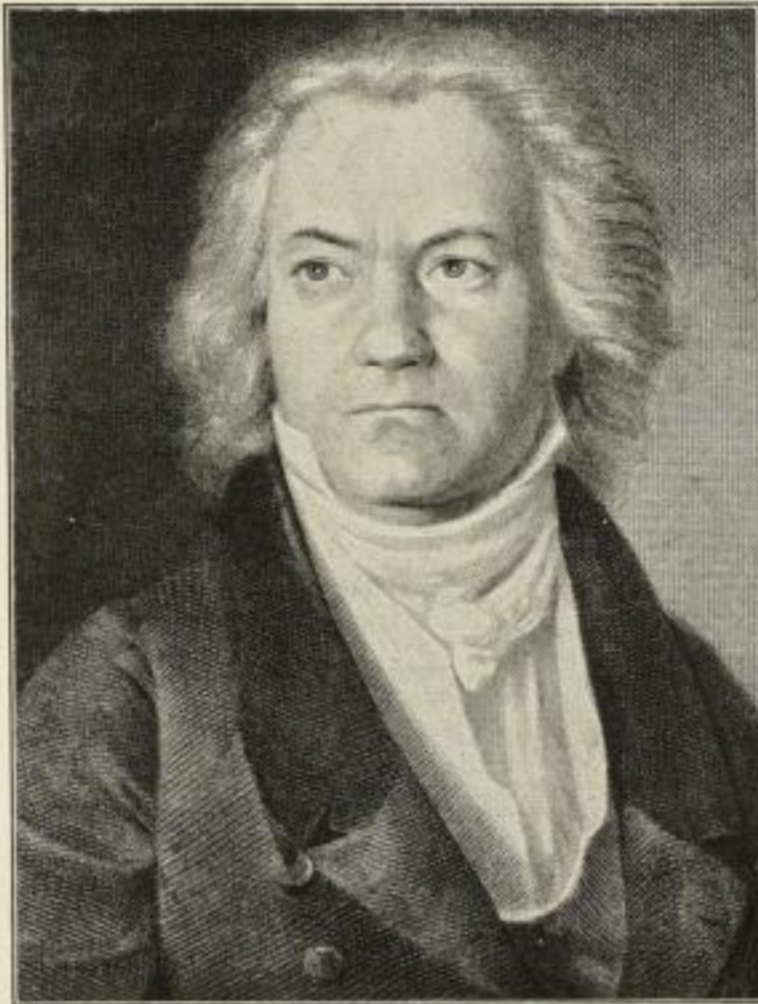
Beethovenbild von Ferd. Georg Waldmüller