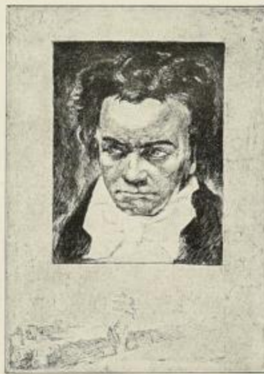
BRUNO HEROUX, Original-Radierung Op. 554. Beethoven Bildgröße 39 × 28 cm 22.50 M.