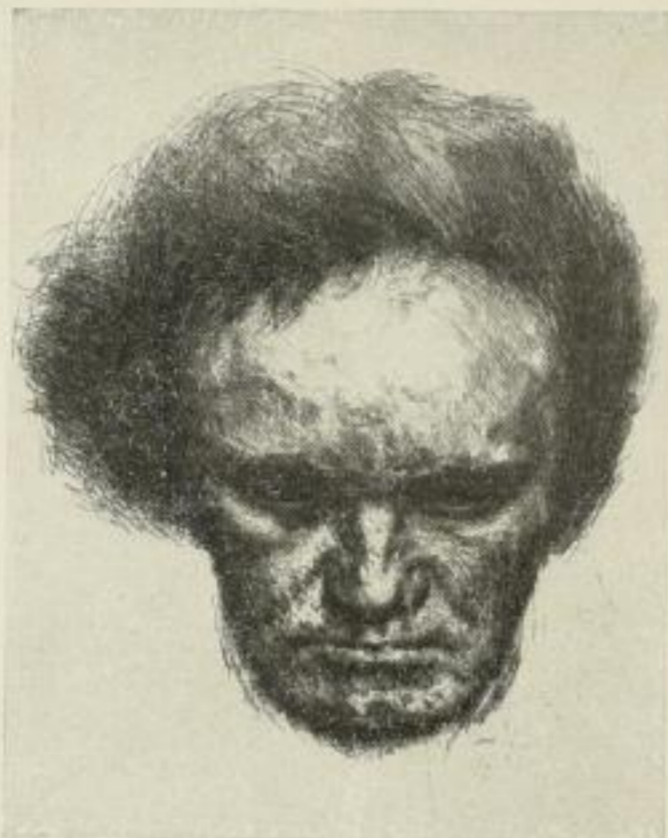
Ernst Pickardt, Beethovenstudie Original-Radierung 30,5:23 cm, M. 20.- ord.

Zum 100 jährigen Todestage Beethovens empfehlen wir: