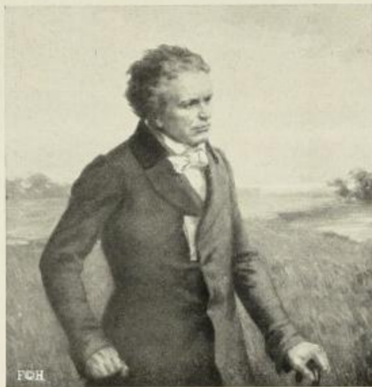
M. Wulff Beethoven Gravüre: Imperial 61:50 cm RM. 15.- Folio 26,5:26 cm RM. 4.- Farbenlichtdruck: 71:69 cm RM. 25.-