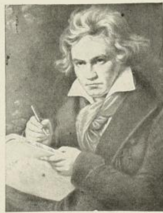
520. J. STIELER, Beethoven Photogravüre: Royal 57 × 50 cm einfarbig 9 M., handkoloriert 15 M.