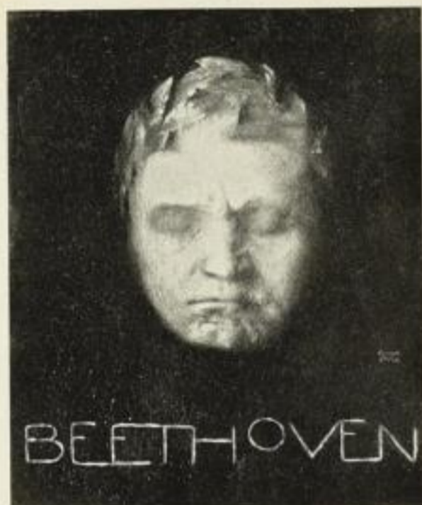
F. v. Stuck P. K. 9452 Gravüre: Folio 24:20 cm RM. 4.- Quart 16:13 cm RM. 2,50 Kabinett RM. 1,50