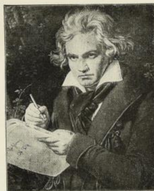
J. Stieler P. K. 254 Faks.-Aqu. 52:43 cm RM. 45.-, Aqu.-Dr. 38:23 cm RM. 4.- Gravüre: Imperial RM. 15.- Royal RM. 9.- Folio RM. 4.- Kabinett RM. 1,50