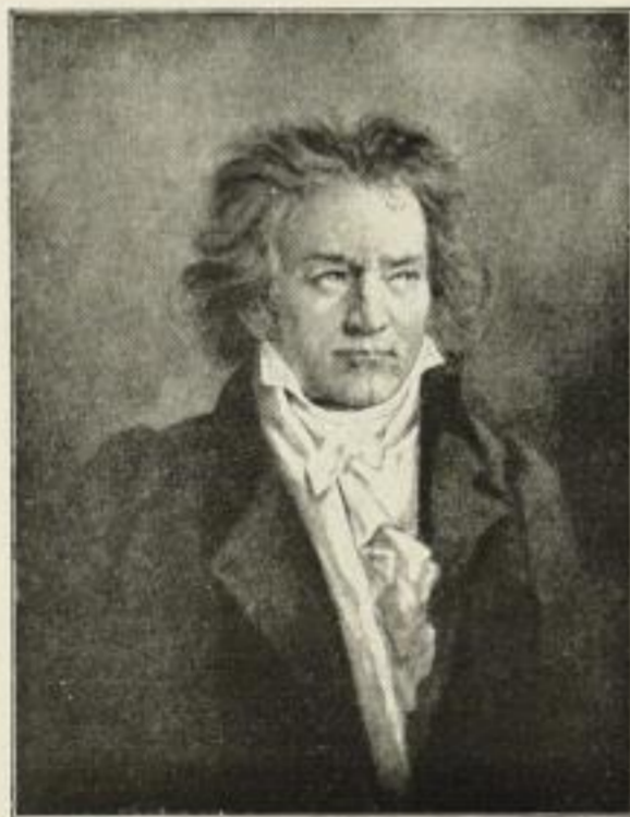
271. W. LEO ARNDT, Beethoven Photogravüre: Royal 46 × 56 cm einfarbig 7.50 M., handkoloriert 12 M.