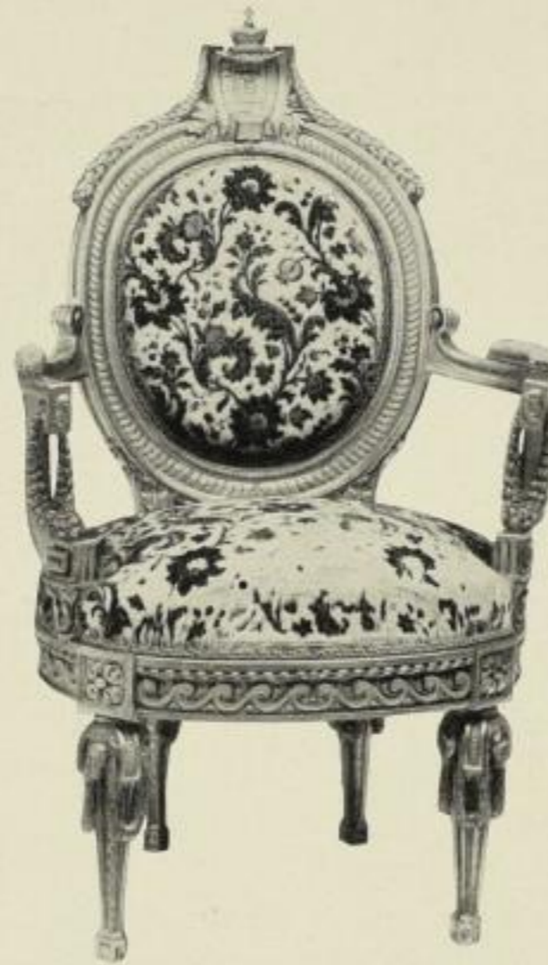
Stuhl mit Wappen des Kurfürsten