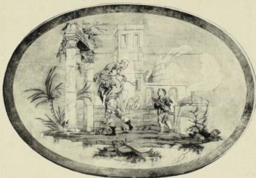
Platte des Tischdiens von David Röntgen (Frankfurt, Sammlung von Hirsch)

ist ein Buch für jeden Kunstfreund, ein Buch für alle Besitzer der Propyläen-Kunstgeschichte, der es in Format und Ausstattung angepaßt ist. Wir liefern es deshalb allen Kontinuations-Beziehern der Propyläen-Kunstgeschichte, wenn nicht ausdrücklich abbestellt wird, ohne besondere Bestellung sogleich bei Erscheinen. Das Werk kostet in Halbleinen M. 45.-, in Halbleder M. 50.-. Vorzugs-Angebot auf dem Bestellzettel!