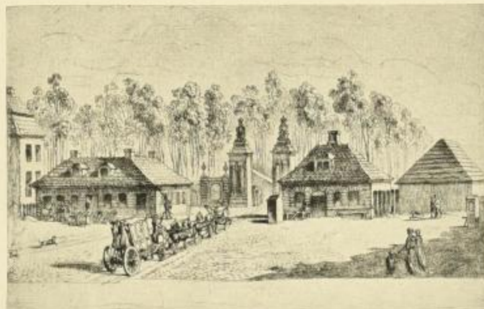
E. 39. Das Brandenburger Tor in Berlin

Wir übernehmen den Verlag der Kupferstiche von Daniel Chodowiecki. Der hier angezeigte Katalog verzeichnet die lieferbaren Blätter, die mit 40% rabattiert werden.