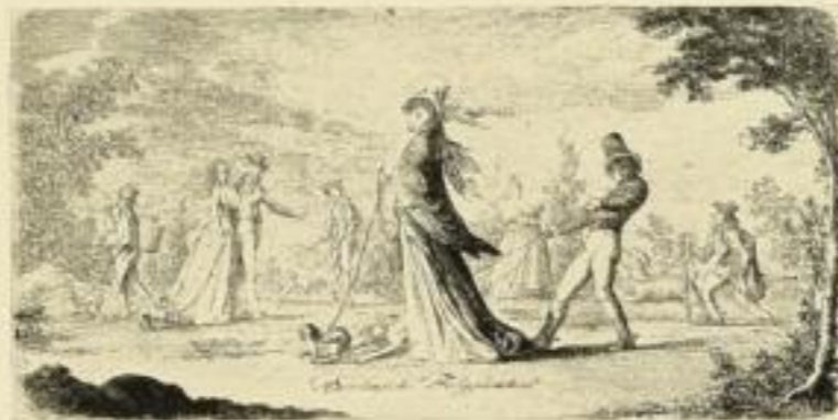
E. 749d. Berlinische Folgsamkeit