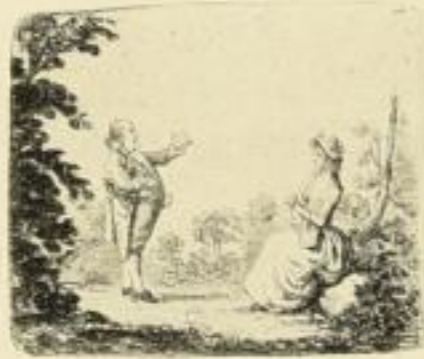
E. 775. Der Aufschneider