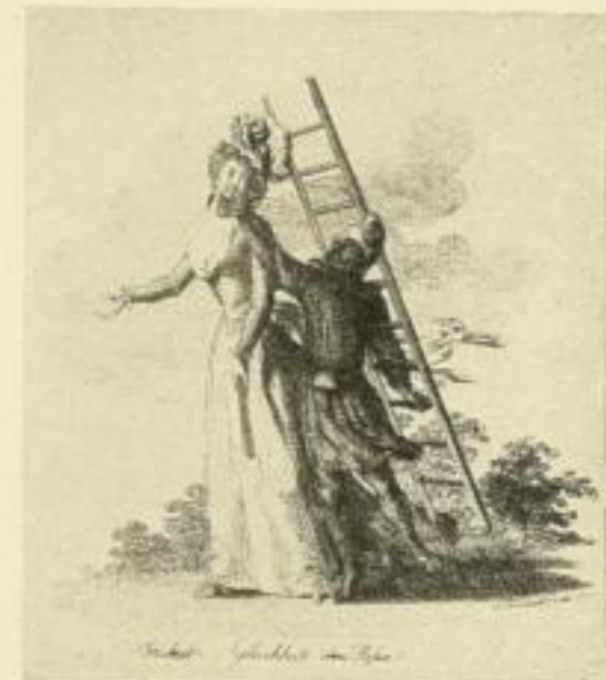
E. 723. Freiheit und Gleichheit, ohne Hosen

Wir übernehmen den Verlag der Kupferstiche von Daniel Chodowiecki. Der hier angezeigte Katalog verzeichnet die lieferbaren Blätter, die mit 40% rabattiert werden.