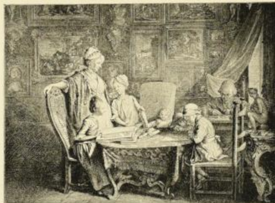
E. 75. Cabinet d'un peintre