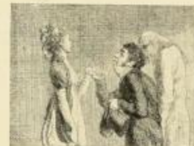
E. 916. Die Höflichkeit