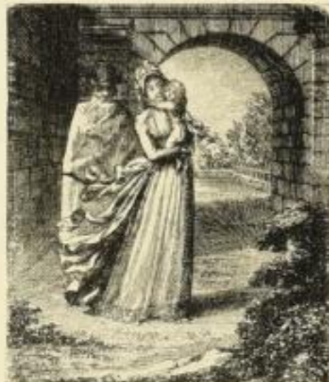
E. 769. Die gute Mutter