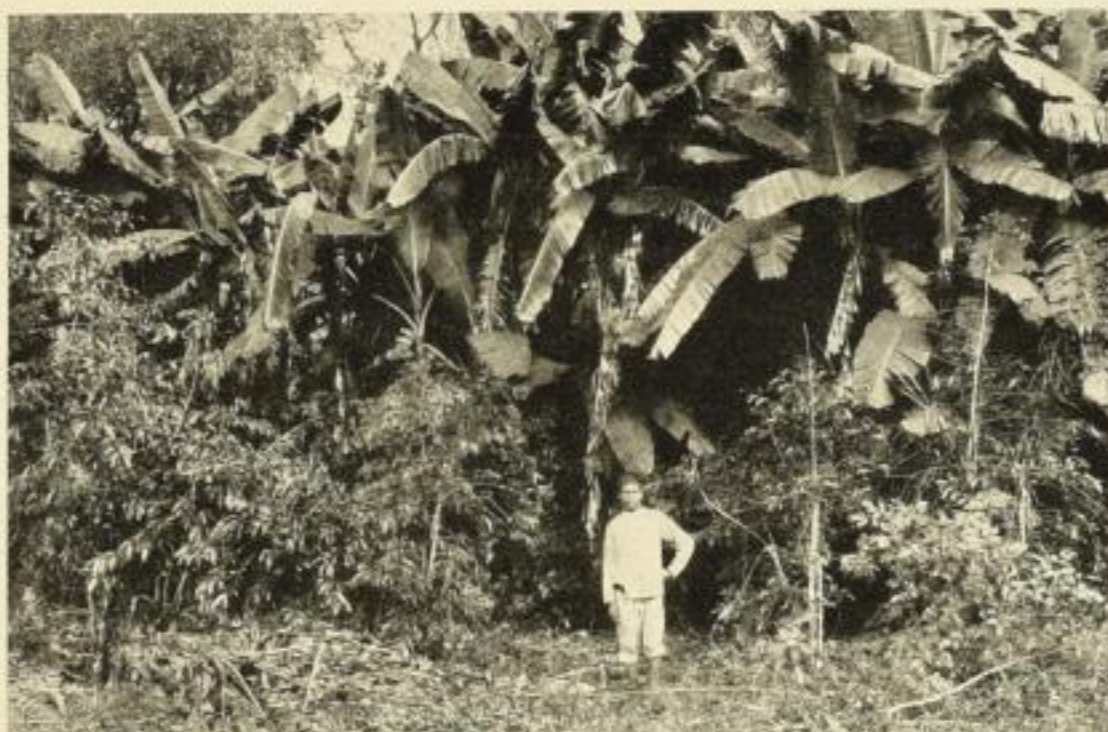
Kaffee- und Bananenpflanzung bei Uruapam

DIE NACHRICHTEN VON DORT VERSTEHT NUR, wer die wirtschaftlichen und historischen Bedingungen des Landes kennt, also, wer das Buch des hervorragendsten deutschen Kenners Mexikos gelesen hat, das soeben neu erscheint: