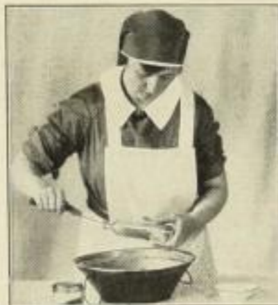
Reinigen der Flasche