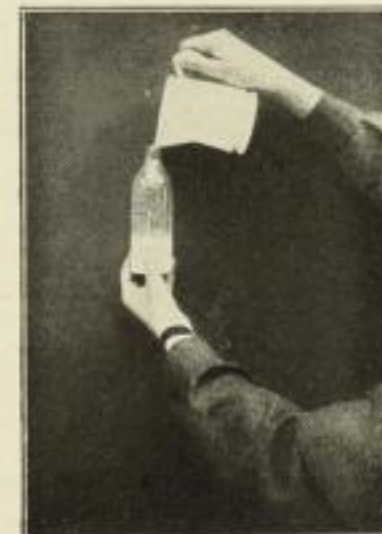
Mischen der Milch

Stark verkleinerte Abbildungen aus den Werken „Das Kind und seine Pflege“ und „Neues Schullehrbuch der Säuglingspflege“