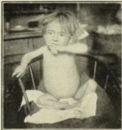
Rachitisches Kind. 2 1/2 Jahre Kann weder gehen noch sprechen

Ein Beweis für die Vortrefflichkeit beider Werke.