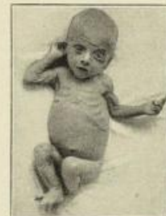
Flaschenkind mit schwerer chronischer Ernährungsstörung