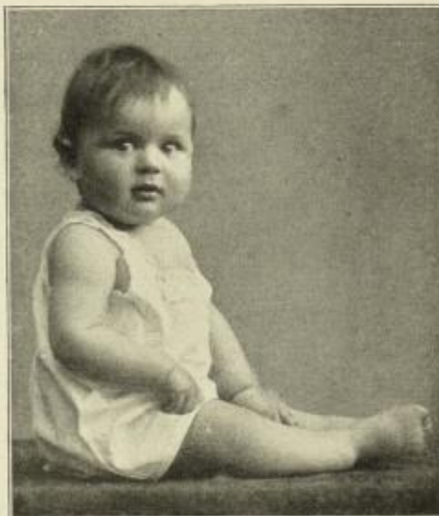
Gesundes Brustkind von 10 Monaten