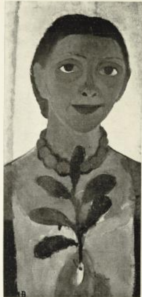
Paula Modersohn-Baker: Selbstbildnis

Der schnelle Nachdruck beweist, daß dieser Band der »Propyläen-Kunstgeschichte« ja auch einer der interessantesten! Ein erster Versuch, Klärung in das das Wertvolle vom Wertlosen zu scheiden, Absichten und Ziele der r