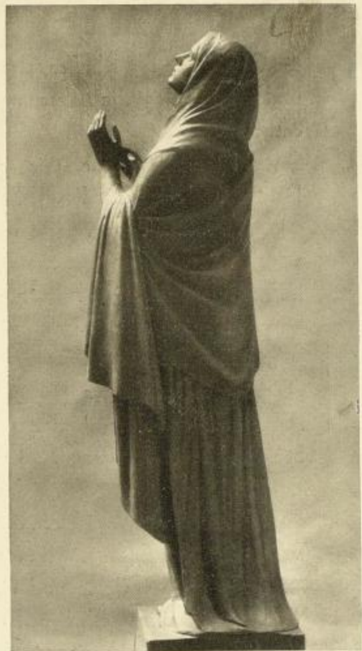
Aus der Kreuzigungsgruppe in Spandau

Gesellschaft für christliche Kunst Kunstverlag GmbH. München, Wittelsbacherplatz 2a