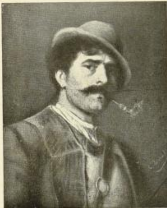
Defregger, Tiroler Bauer