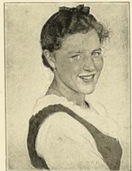
Bernuth, Tiroler Mädchen

G. HIRTH'S VERLAG, MÜNCHEN HERRNSTRASSE 10