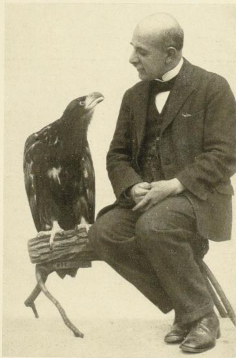
Der Verfasser mit seinem Seeadler

HUGO BERMÜHLER VERLAG / BERLIN-LICHTERFELDE