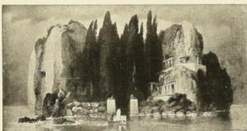
A. BÖCKLIN Die Insel der Toten 1417 50 1/2 x 95 cm (Neuausgabe) Doppelblatt 146 35 1/2 x 68 cm, weißer Rand 57 x 86 cm Normalblatt