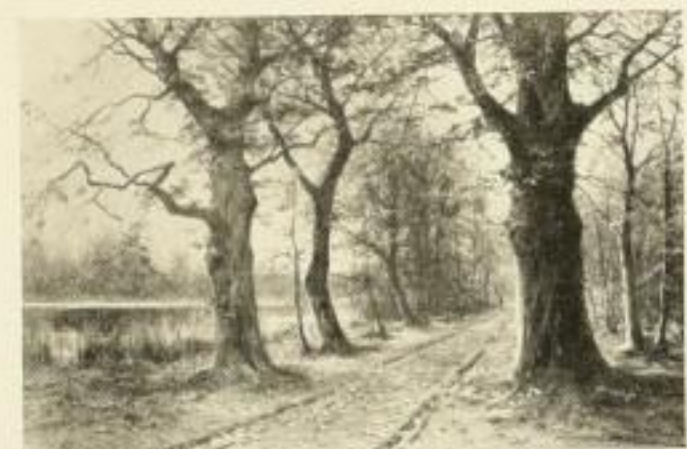
1039 W. MORAS Buchenallee im Herbst 64×96 cm Zwischenblatt