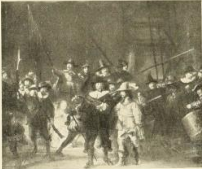
198 REMBRANDT Die Nachtwache 73×88½ cm Doppelblatt

50 % Rabatt · 7/6 in gleicher Preislage / Hauptkatalog mit ca. 600 Abbildungen Mk. 2.—