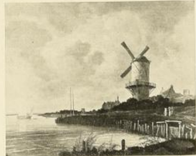
135 J. VAN RUISDAEL Windmühle 72×90 cm Doppelblatt