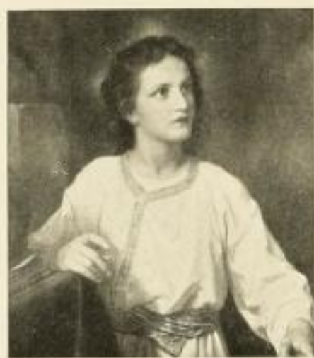
HEINR. HOFMANN Jesusknabe 291 58 3/4 x 68 cm Normalblatt 291d 32 x 40 cm Drittelblatt