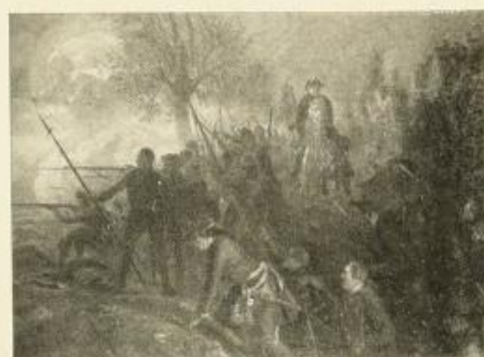
1386 ADOLPH VON MENZEL Friedrich der Große und die Seinen bei Hochkirch 69 1/2 x 90 1/2 cm Doppelblatt

Farbengetreue Wiedergaben berühmter Gemälde