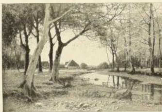
MÜLLER-KURZWELLY Fallende Blätter 1046 65×97 cm Zwischenblatt 1046b 26×40 cm Viertelblatt