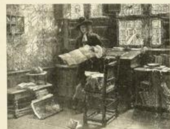
1023 M. GAISSER Der Archivar 48×62 cm Normalblatt