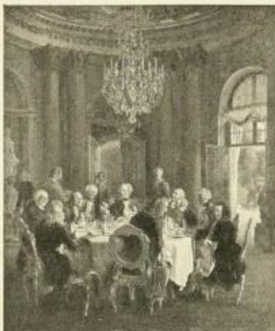
185 ADOLPH VON MENZEL Tafelrunde Friedrichs II. in Sanssouci 52 1/2 x 62 cm Normalblatt