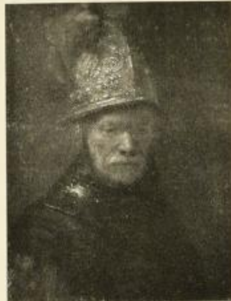
292 REMBRANDT Mann mit Goldhelm 50×67 cm Normalblatt