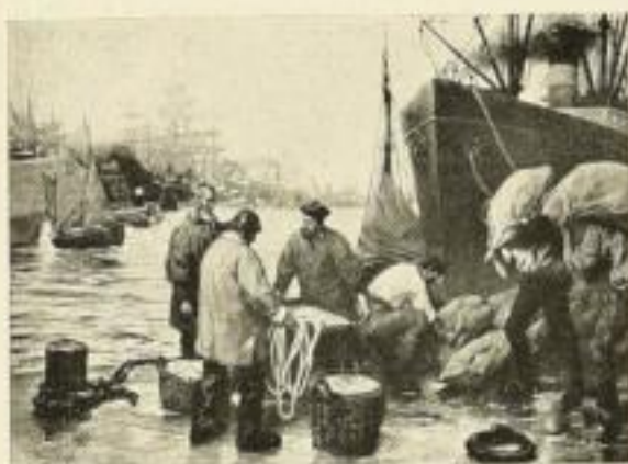
1108 H. VOGEL Welthandel 71½×96 cm Doppelblatt