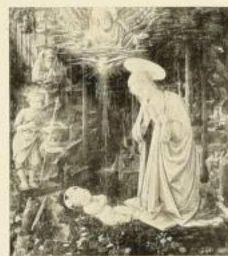
320 FILIPPO LIPPI Anbetung 56 x 62 cm Normalblatt