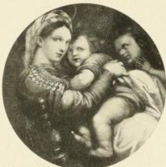
2 RAFFAEL Madonna della Sedia 70 cm Durchmesser Zwischenblatt