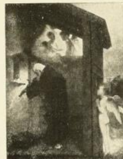
A. BÖCKLIN Der Eremit 81 48 x 63 cm Normalblatt 1413 29 1/4 x 37 cm Sonderpreis