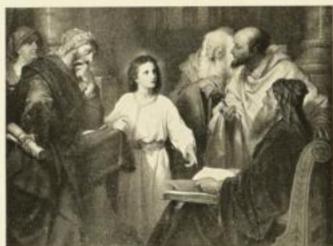
HEINR. HOFMANN Der 12jähr. Jesus im Tempel 249e 70 x 95 cm Zwischenblatt 249 50 x 67 1/2 cm Normalblatt 249a 36 x 49 1/2 cm Halbblatt