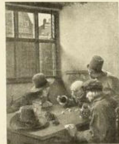
CL. MEYER Die Würfler 196 51×66 cm Normalblatt 196e 42×54 cm Klein-Normalblatt