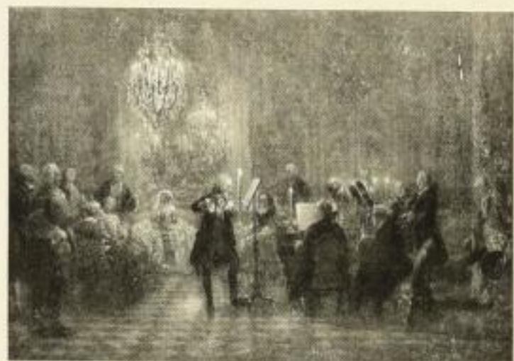
A. v. MENZEL Flötenkonzert Friedrichs II. in Sanssouci 1062 43 1/2 x 63 cm Normalblatt 1062e 64 x 93 cm Zwischenblatt 1063 63 x 91 1/2 cm Doppelblatt