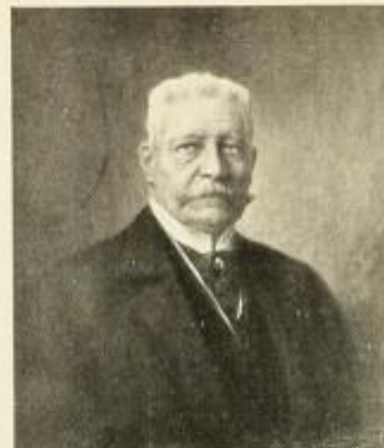
344 H. VOGEL Reichspräs. v. Hindenburg 57½×71 cm Normalblatt