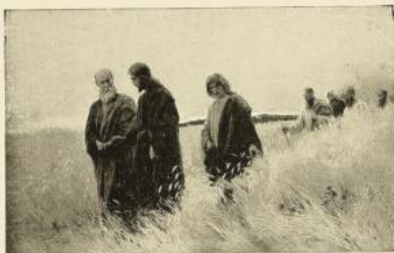
J. R. WEHLE Und sie folgten ihm nach 137e 59 x 94 cm Zwischenblatt 137 47 x 74 cm Normalblatt 137a 34 x 54 1/2 cm, weißer Rand 55 x 72 cm Halbblatt 137b 20 x 32 cm, weißer Rand 40 x 51 cm Viertelblatt