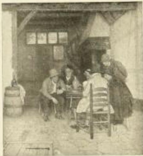
1006 CL. MEYER Kartenspieler 57×62½ cm Normalblatt