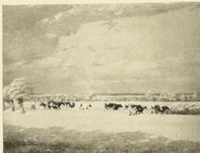
342 C. A. BRENDEL Aufziehendes Gewitter 66½×89½ cm Zwischenblatt