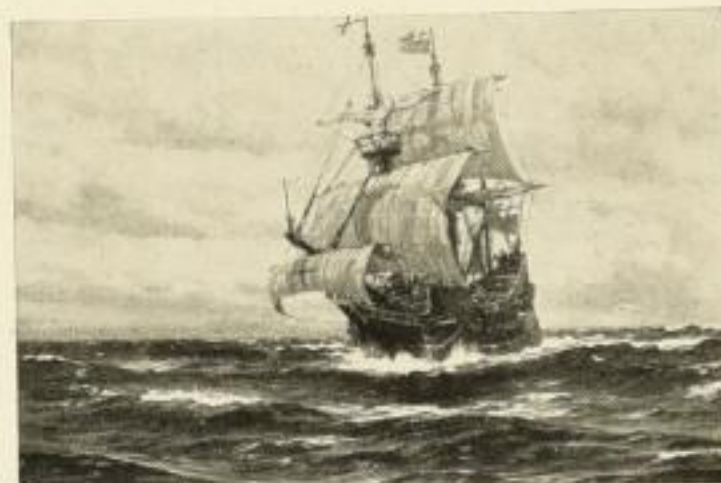
347 CLAUD BERGEN Hudson's „Halbmond“ auf dem Atlantik 1609 67×92 cm Zwischenblatt