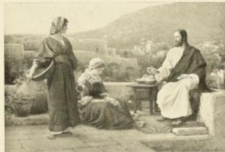
165 H. SEEGER Jesus bei Maria und Martha 50 x 71 1/4 cm Normalblatt