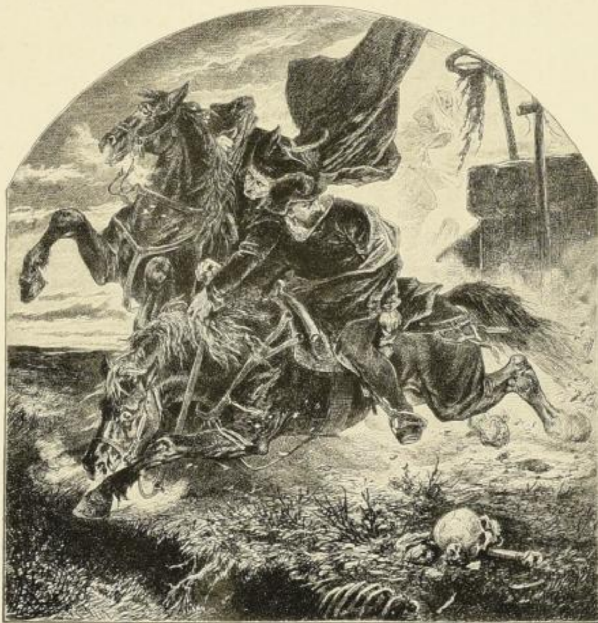
Liezen-Mayer: Mephisto: „Vorbei! Vorbei!“

... Man muß sich freuen, daß es möglich war, diesen brillanten Einfall zu verwirklichen; denn dieses Buch hat tatsächlich gesehlt. Fast alle deutschen erzählenden Künstler sind, neben dem Franzosen Delacroix, um die graphische und malerische Fixierung der Hauptscenen des „Faust“ bemüht gewesen. Das Buch ist . . . in der vorliegenden Form . . . ein echtes und rechtes deutsches Hausbuch . . . Münchener Zeitung.