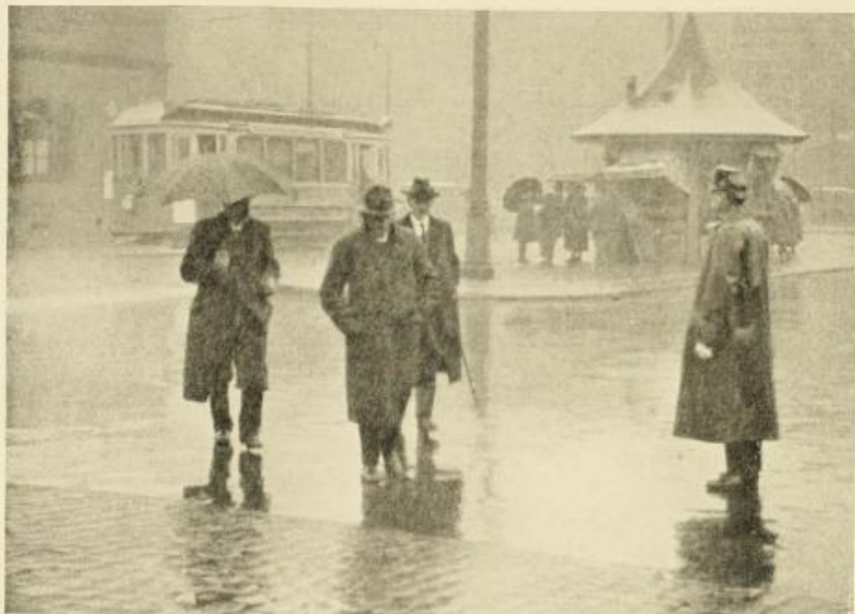
Schnee und Regen