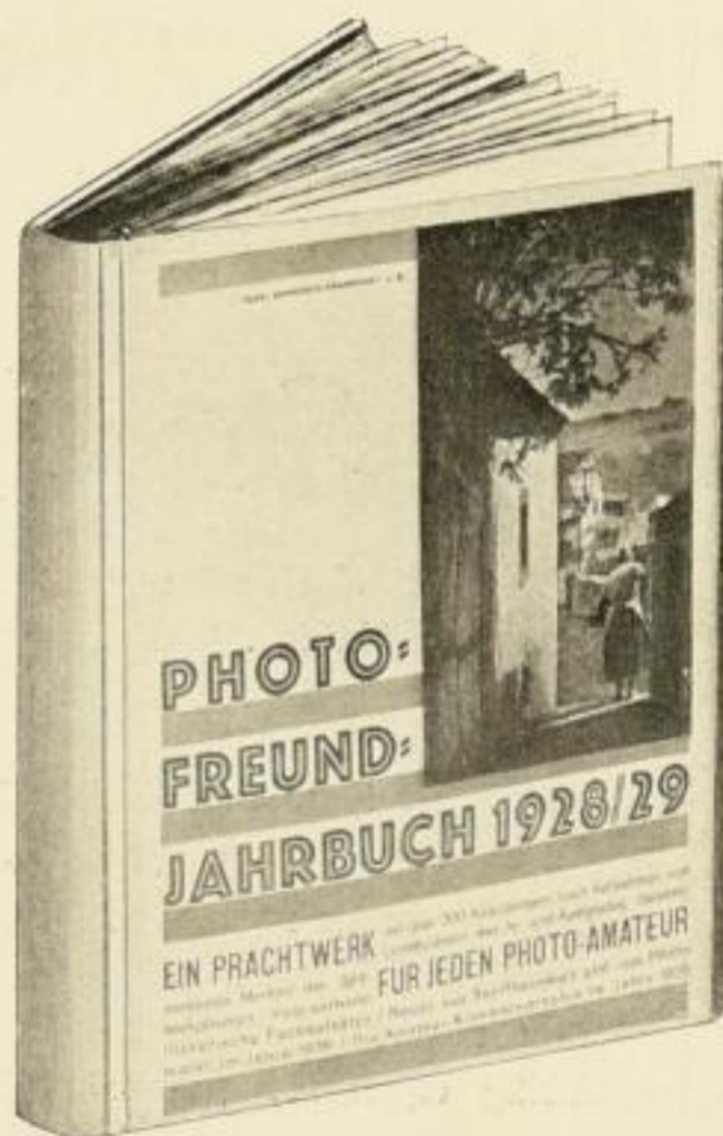
Preis RM. 6.80 ord., RM. 4.50 no.

VERLAG GUIDO HACKEBEIL A.-G. BERLIN S 14, STALLSCHREIBERSTRASSE 34/35