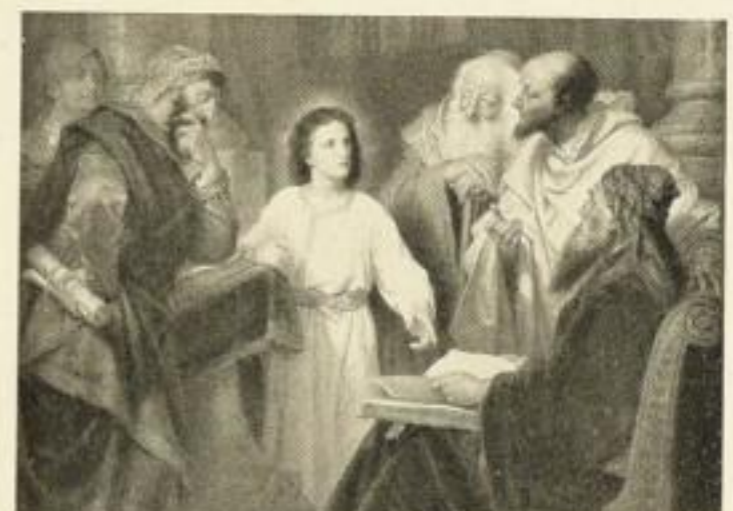
H. HOFMANN Der zwölfjährige Jesus im Tempel 249c 70×95 cm 22.— RM 249 50×67½ cm 16.— RM 249a 36×49½ cm 8.— RM