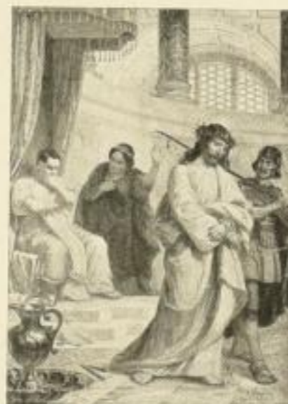
KASPAR SCHLEIBNER Der heilige Kreuzweg in 14 Stationen 1326 50×70 cm Serie 125.— RM 1326a 25×35½ cm Serie 45.— RM