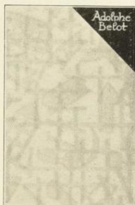
Der abnehmbare Schutzumschlag