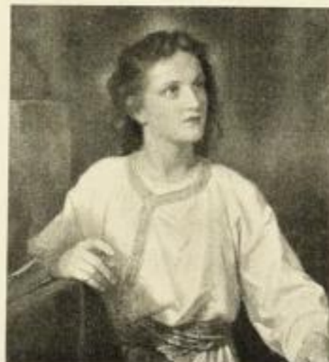
HEINR. HOFMANN Jesusknabe 291 58¾×68¼ cm 16.— RM 291d 32×40 cm 5.— RM