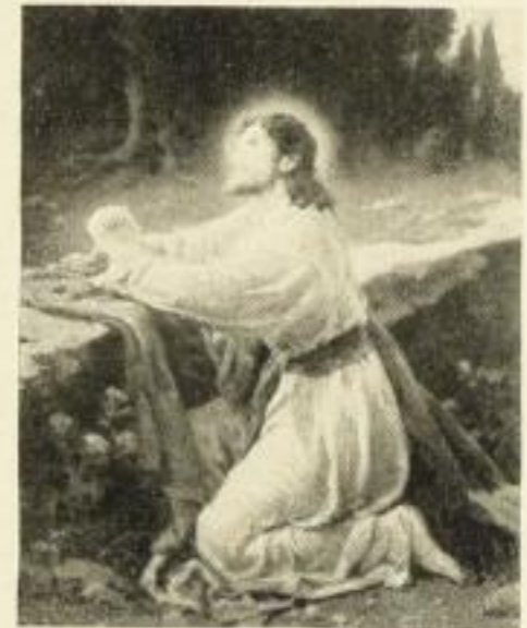
341 H. CLEMENTZ Gethsemane 53×66 cm 16.— RM