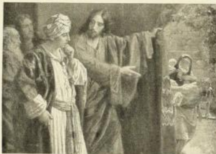
H. CLEMENTZ Christus und der reiche Jüngling 322c 70×95 cm 22.— RM 322 50×67½ cm 16.— RM 322a 36×49½ cm 8.— RM