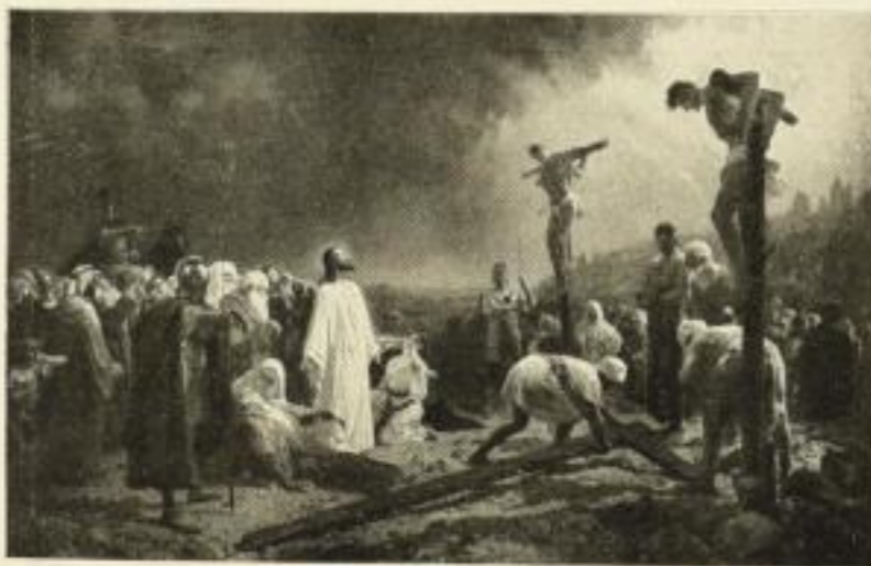
176 H. CLEMENTZ Golgatha 61½×96¾ cm 22.— RM