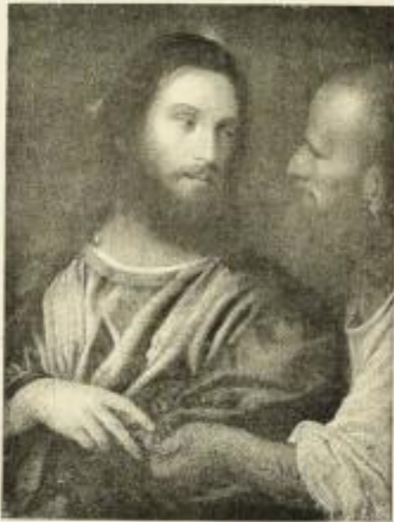
1099 TIZIAN Der Zinsgroschen 49×64 cm 16.— RM

Unser Hauptkatalog enthält 87 religiöse Bilder, von denen wir zur Osterzeit auf folgende hinweisen