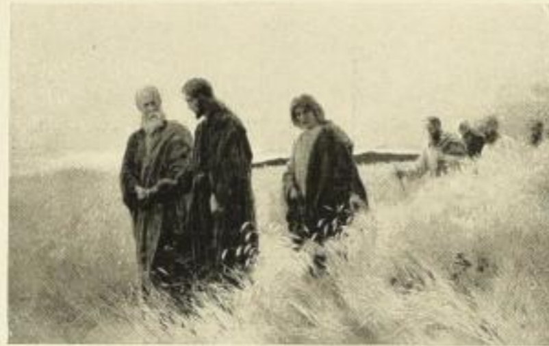
J. R. WEHLE Und sie folgten ihm nach 137c 59×94 cm 22.— RM 137 47×74 cm 16.— RM 137a 34×54 cm 8.— RM 137b 20×32 cm 3.75 RM