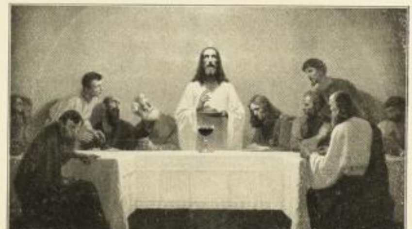
193 G. FUGEL Das heilige Abendmahl 57¾×100¾ cm 22.— RM

KUNSTVERLAG TROWITZSCH & SOHN · FRANKFURT-ODER