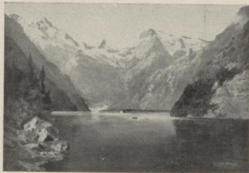
Nr. 4 Th. Guggenberger, Der Königssee