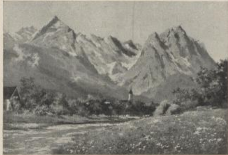
Nr. 2 Th. Guggenberger, Garmisch mit Alp- und Zugspitze