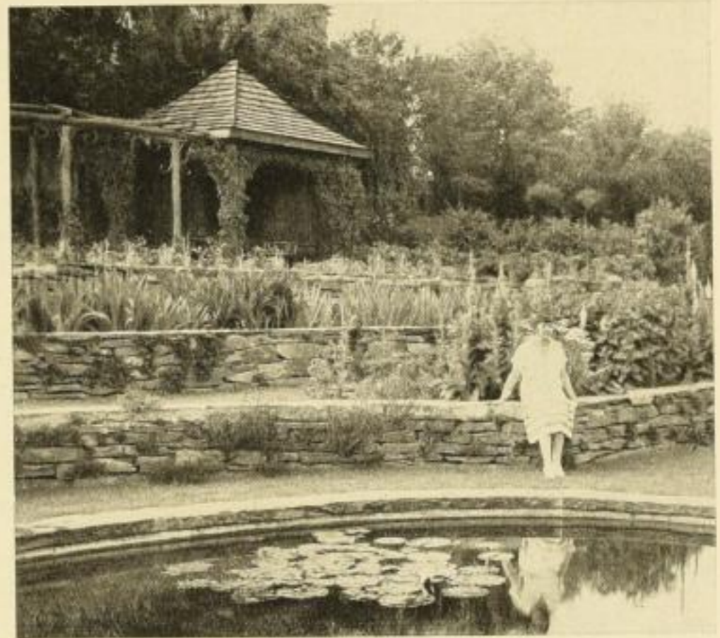
Die nicht erheblichen Höhenunterschiede wurden in Blütenterrassen gegliedert. Das Material für die Mauern lieferte das in Grün und Blau lebhaft nuancierende Schiefergestein.