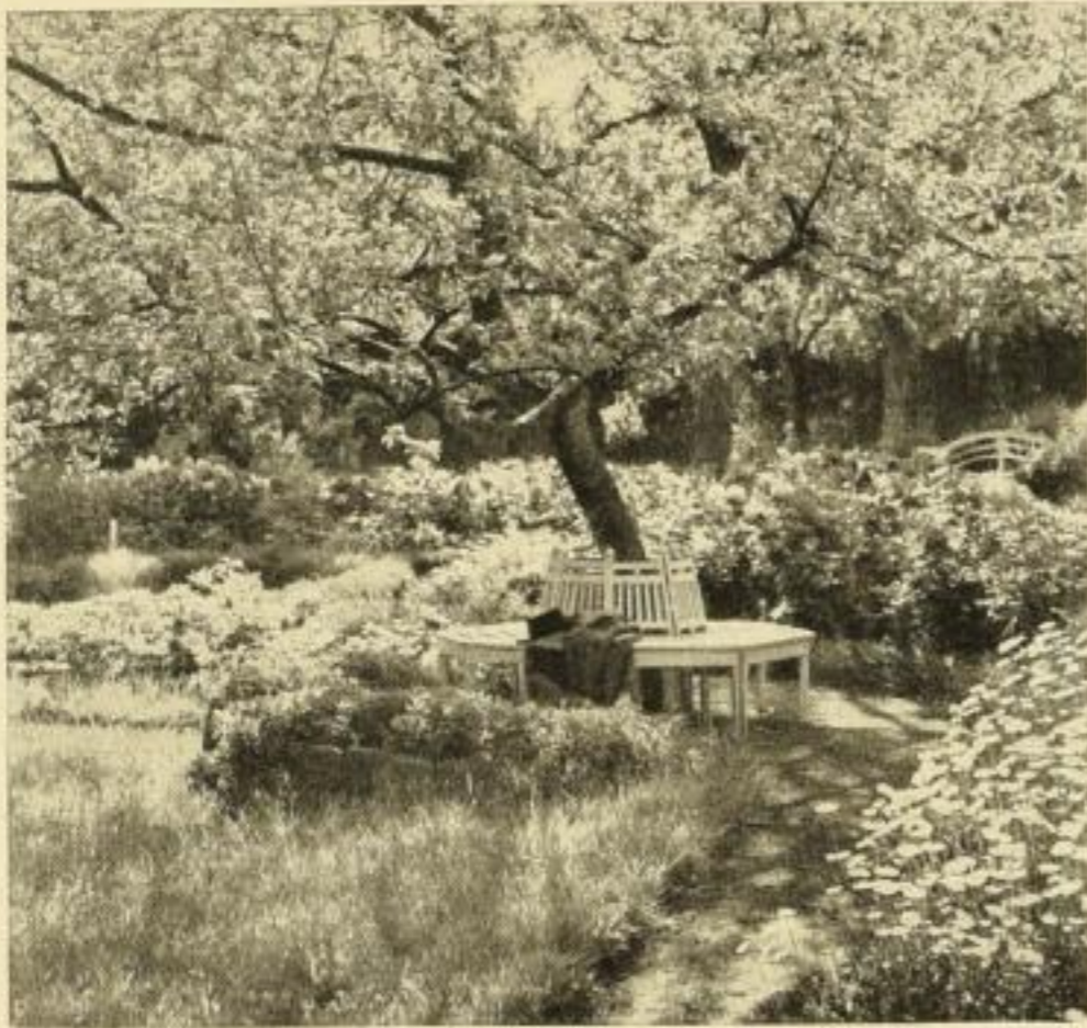
Ein alter Obstbaum veranlaßte Ausbreitung und Bodengestaltung. Inmitten köstlicher Frühjahrsblüte steht der eifrigst benützte Platz im Garten.