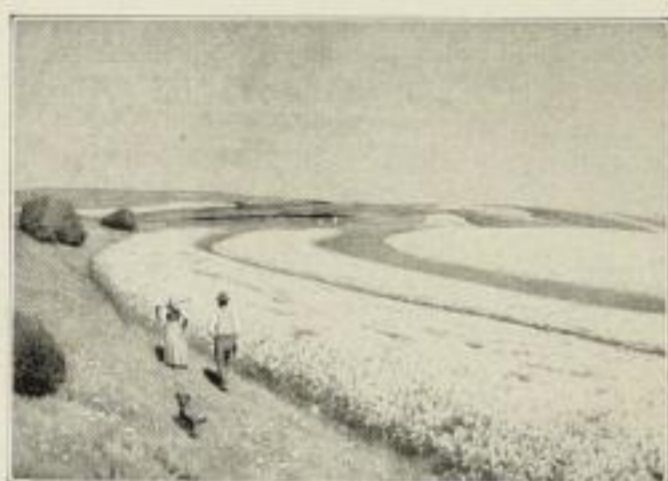
184 H. v. Volkmann, Blühende Rapfeld 100/70