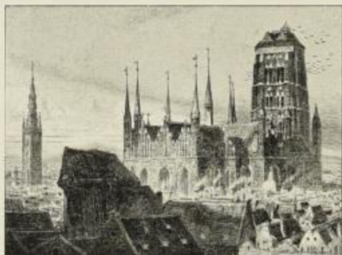
228 Th. Uetnowski, St. Marien in Danzig 55/42