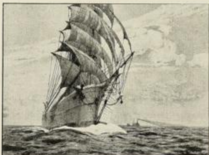
197 A. Liedtke, Die Bark 75/55