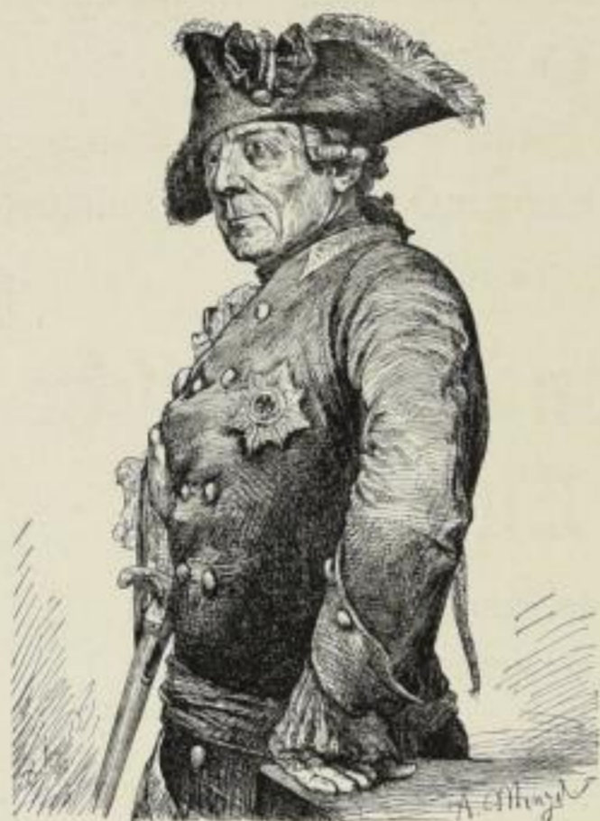
539 Adolph von Menzel, Friedrich der Große 75/55