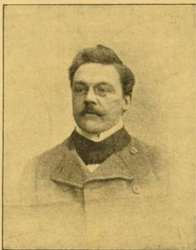
Ludwig Thoma (Peter Schlemihl des Simplificissimus)

Ⓜ Heute wurden ausgegeben das fünfte und sechste Tausend von Ludwig Thoma's Bauerngeschichte