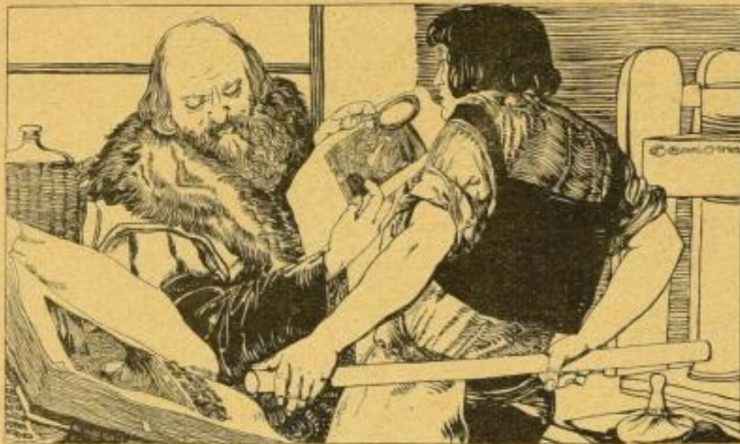
Diätesschrift: Congress Wien.