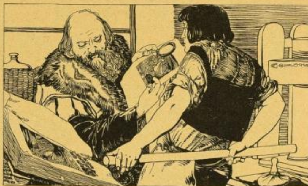
Drehstempel: Caspary Wien.