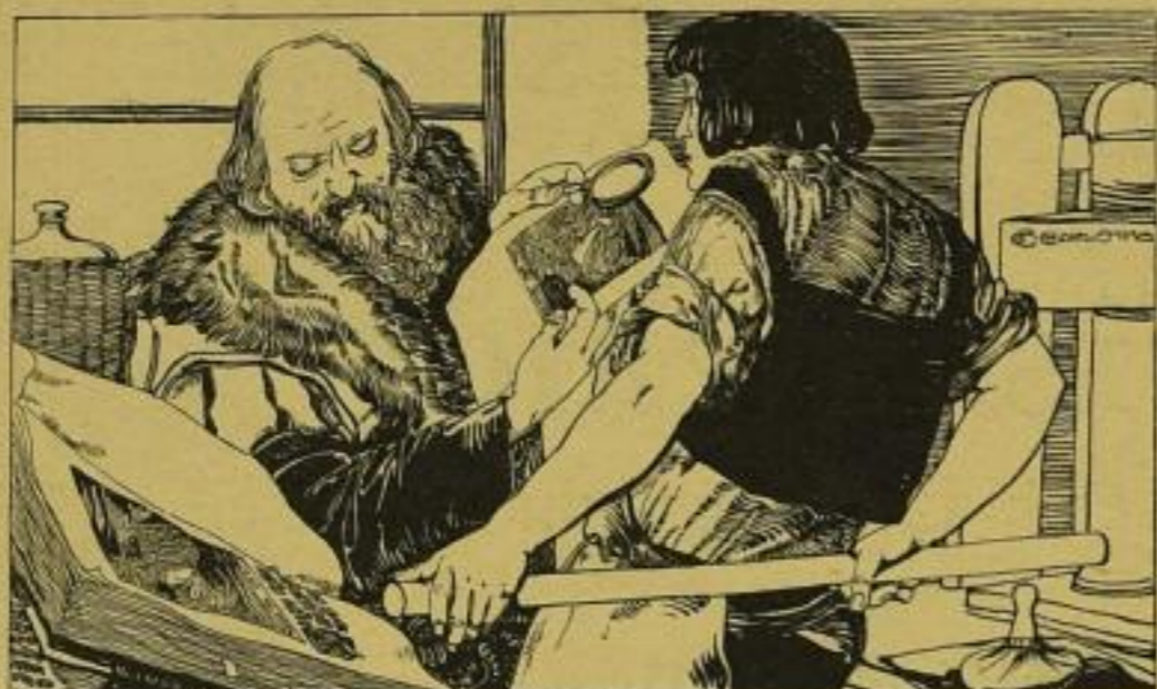
Drohenschrift: Gaggerer Wien.