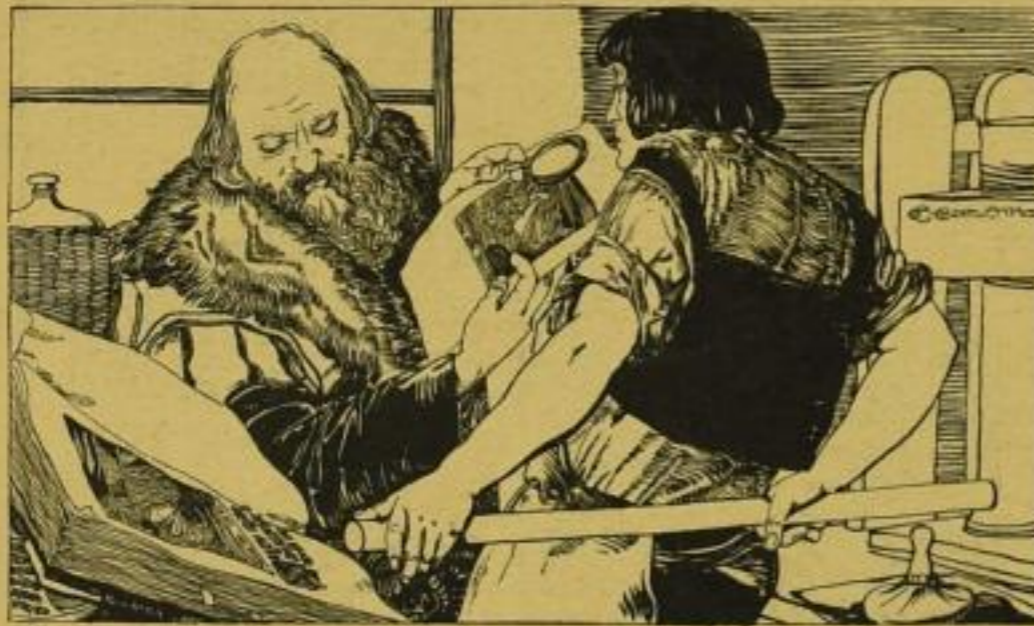
Druckenschriftl. Congerit Wien.