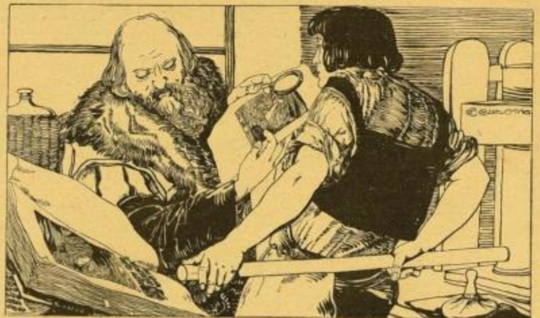
Drehlehre: Angerer Wien.