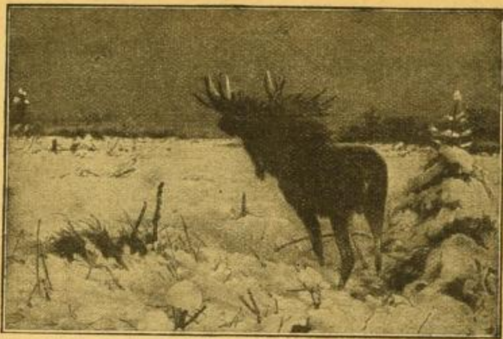
friesse, „Eich auf Aefung ziehend“, Aquarellgravüre. Karton 62x89 cm, Bild 58x58 cm groß.