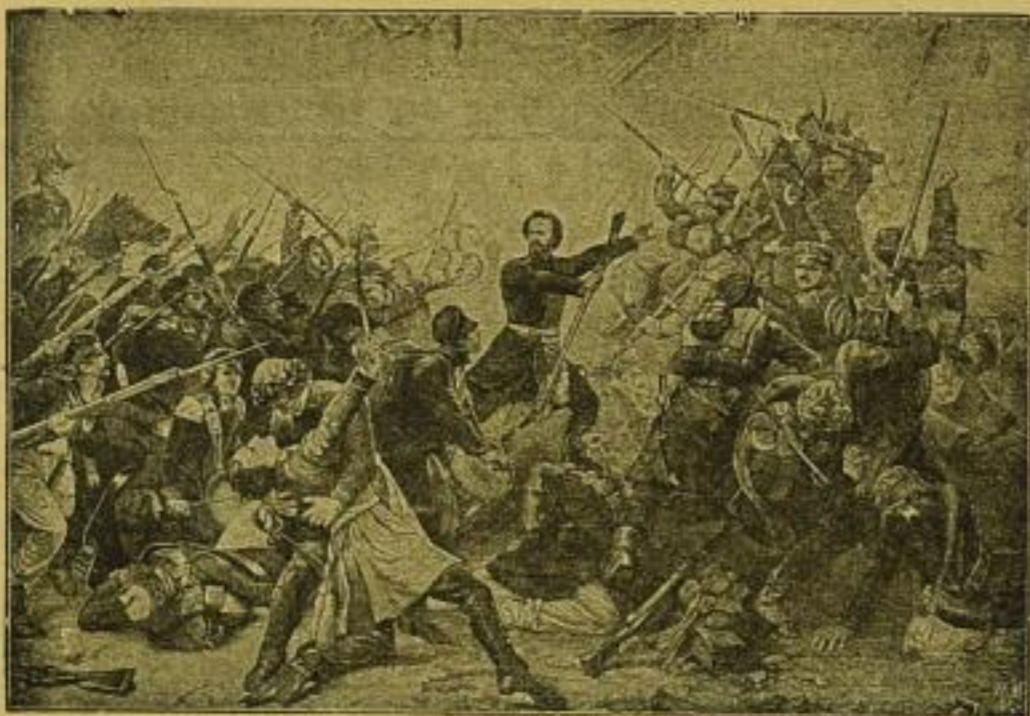
Erstürmung des Grimmalschen Tores in Leipzig. (1/5 der Orig.-Grösse.)

Zu beziehen in 20 Lieferungen à 50 Pf. ord. (Lieferung 1 gratis) oder in hochelegantem Prachtband, Brokatvorsatz, 12 Mk. ord., 9 Mk. netto, 8 Mk. bar