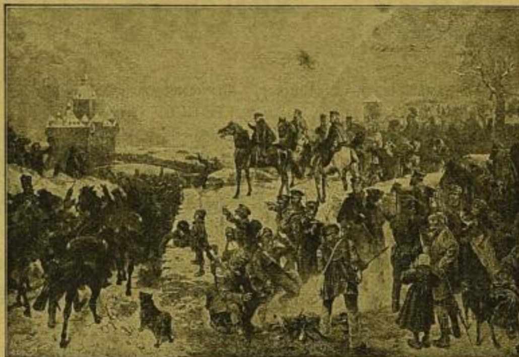
Blüchers Rheinübergang. Gemälde von W. Camphausen (1/5 der Originalgrösse.)