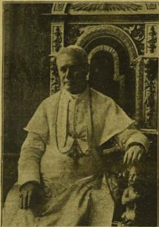
Verkleinerte Wiedergabe der Aufnahme im weissen Calar. — Kniestück.