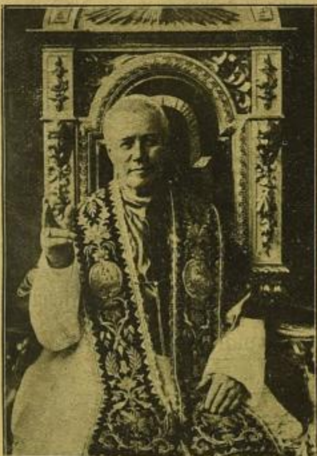
Verkleinerte Wiedergabe der Aufnahme in Stola und Mozzetta. — Kniestück.

Die Preise dieser Aufnahmen betragen auf starkem Karton mit eingepprägtem Plattenrand pro Bild in