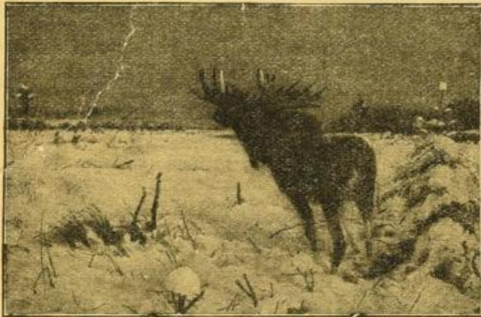
Friesse, „Elch auf Äsung ziehend“, Aquarellgravüre. Karton 62x89 cm, Bild 38x58 cm groß.

Die prachtvolle farbige Reproduktion des Frieseschen Meisterwerkes ist in meinen Verlag übergegangen. Um weiten Kreisen die Erwerbung einer tadellosen Darstellung des interessanten, im Verschwinden begriffenen Wildes zu ermöglichen, ist von mir der Netto-Preis äußerst billig auf M. 3.— u. 7/6 normiert (früherer Ladenpreis M. 20.— ). Ordinär-Preis jetzt M. 10.— . Die Aquarellgravüre ist in der bekannten Kunstanstalt von Meisenbach Riffarth & Co. hergestellt und liefere ich nur durchaus tadellose Exemplare. Gerahmt unter Glas in breitem Eichen- oder Aufbaumrahmen, 75x104 cm groß, frachtfrei inkl. Kiste durch ganz Deutschland M. 18.— , ohne weißen Papierrand gerahmt macht das Bild den Eindruck eines Original-Aquarells und kostet in Eichen- oder Aufbaumrahmen, 52x73 cm groß, franko M. 13.50 . Sämtliche Preise netto bar, etwa Nichtgefallendes nehme zurück.