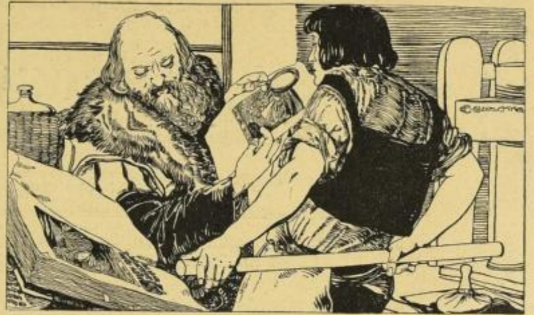
Druckschritt: Congerer Wien.