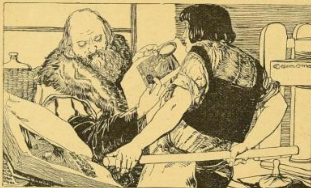
Druckenschrift Caspary Wien.