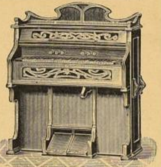
No. 8090. Haus-Organ, Eichengeh., 5 Oktaven, 122 St., 7 Reg. M. 147.— No. 8092. Dieselbe in Nussbaum M. 158.80