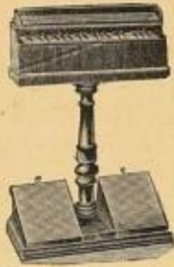
No. 8002. Zusammenlegbares Harmonium, 3 1/4 Oktaven, 40 Stimmen M. 51.— No. 8004. Desgl., 4 Oktaven, 74 Stimm., 3 Register M. 78.40

Fabrik von Orgel-Harmoniums. — Nettopreise gegen Barzahlung für Buch- und Musikalienhändler.