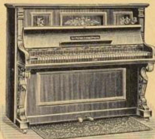
No. 8095. Haus-Organ, Eichengeh., 5 Oktaven, 122 St., 11 Reg. M. 176.40 No. 8097. Dieselbe in Nussbaum M. 186.20