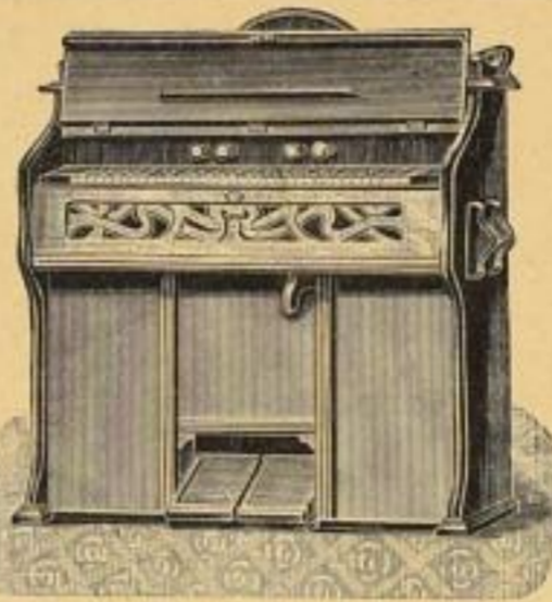
No. 8085. Zimmer-Organ, Eichengeh., 5 Oktaven, 61 Stimm., 5 Reg. M. 122.50