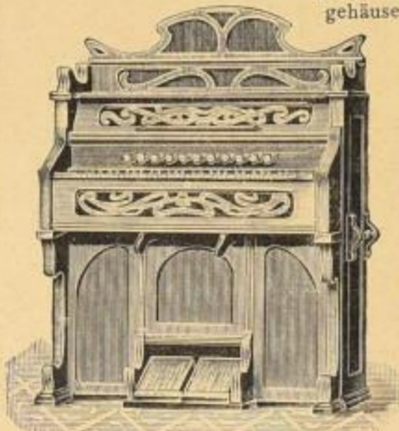
No. 8098. Kabinet-Organ } Nussbaumgeh., 5 Oktaven, 122 Stimmen, 13 Register, M. 210.70