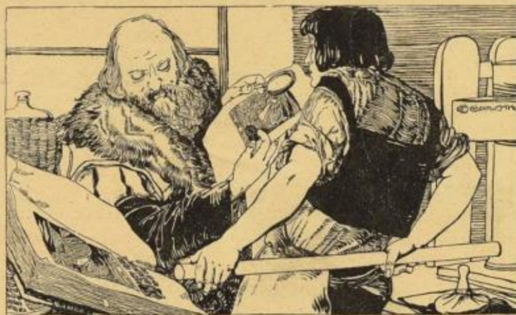
Druckenschrift: Cangerer Wien.