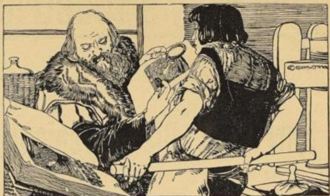
Drahtenschrift: Congerer Wien.