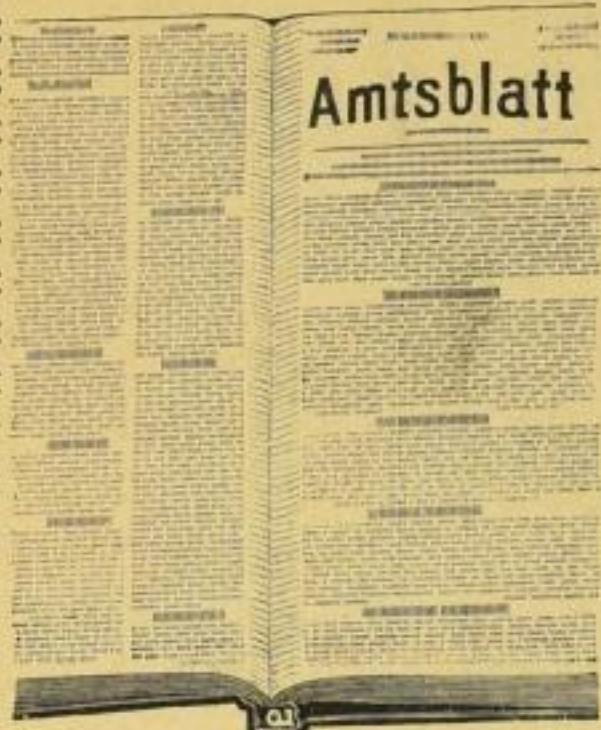
Aufgeschlagene Sammel-Mappe mit Patent-Rückenbeschlag u. Kantenschonern.

Einbanddecken- und Patent-Buchbeschlüge-Fabrik. Gegründet 1875.