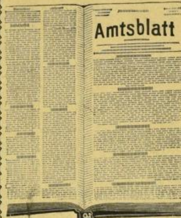
Aufgeschlagene Sammel-Mappe mit Patent-Rückenbeschlag u. Kantenschonern.

Einbanddecken- und Patent-Buchbeschläge-Fabrik. Gegründet 1875.