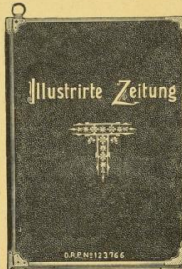
Patent-Lese-Mappe mit Kantenschönern (Metall-Einfassung der Ränder). Unverwüßlich.