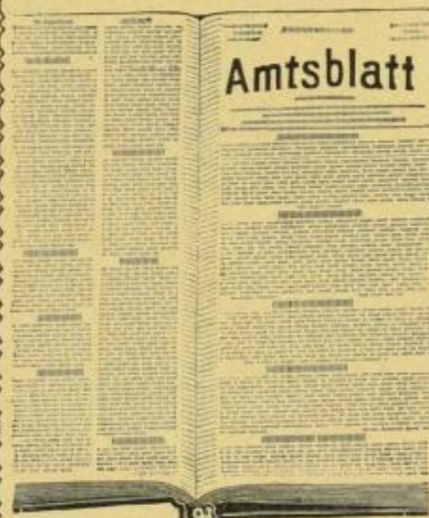
Aufgeschlagene Sammel-Mappe mit Patent-Rückenbeschlag u. Kantenschonern.