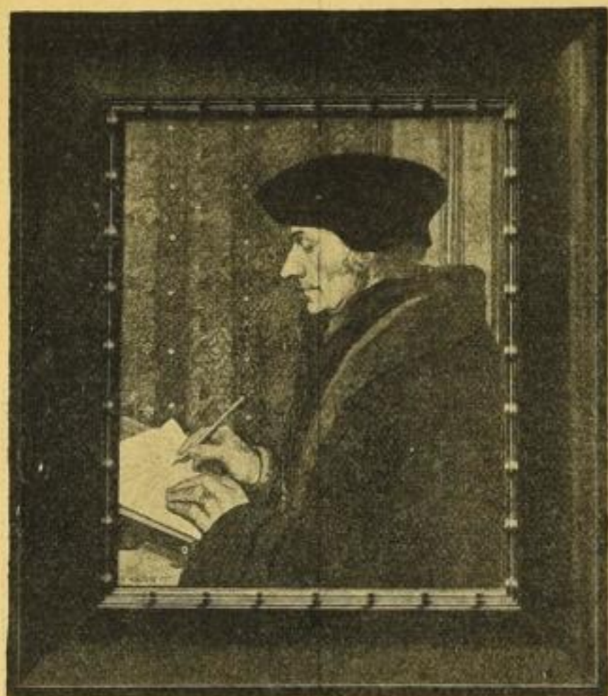
HOLBEIN: Erasmus von Rotterdam.

AMSLER & RUTHARDT, Königl. Hofkunsthdlgung, BERLIN W. 64, Behrenstr. 29a.