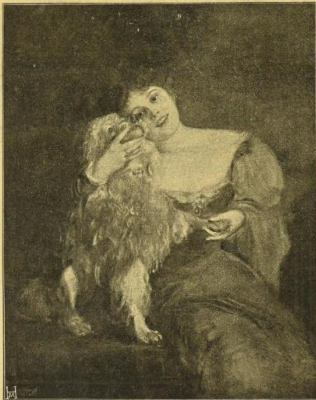
Verkleinerte autotypische Abbildung aus F. v. Lenbach, Schönheit-Ideale

24 Photogravüren nach Originalen weiblicher Bildnisse sowie ein Selbstbildnis von