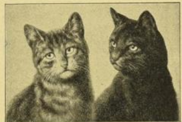
Sperling, Hinz und Kunz.

Gravüren. Bildgröße 25:18 cm, Papiergröße 50:37 cm Mk. 3.— ord., Mk. 2.— no. „ 15:11 „ „ 27:21 „ „ 1.— „ —.60 „