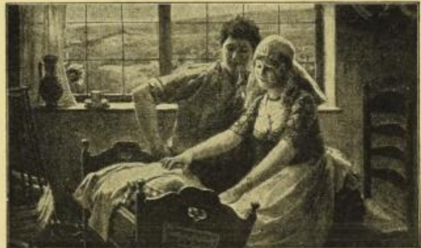
Eichstaedt, Glück im Winkel.