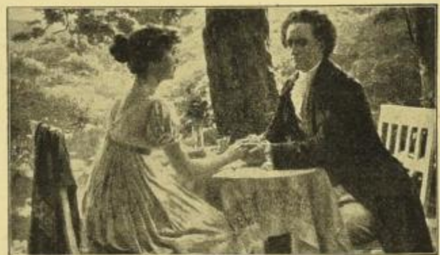
Eichstaedt, Goethe und Minchen Herzlieb.