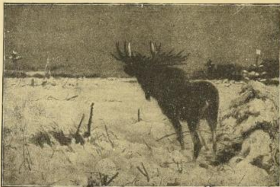
Friesle, „Eich auf Nung stehend“, Aquarellgravüre. Karton ca. 55x80 cm, Bild 58x58 cm groß.