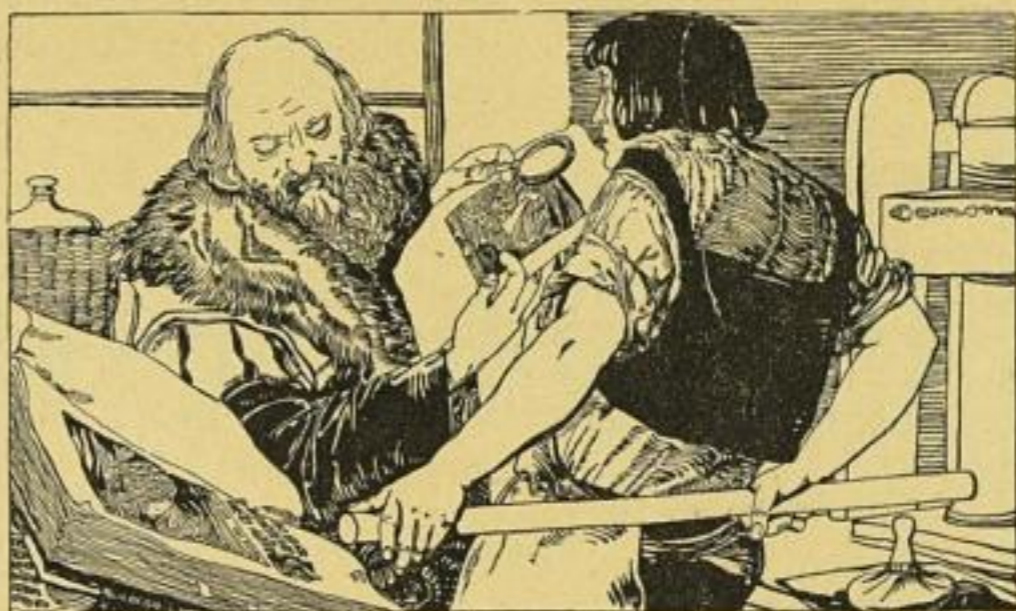
Drehmühl: Cengier Wien.