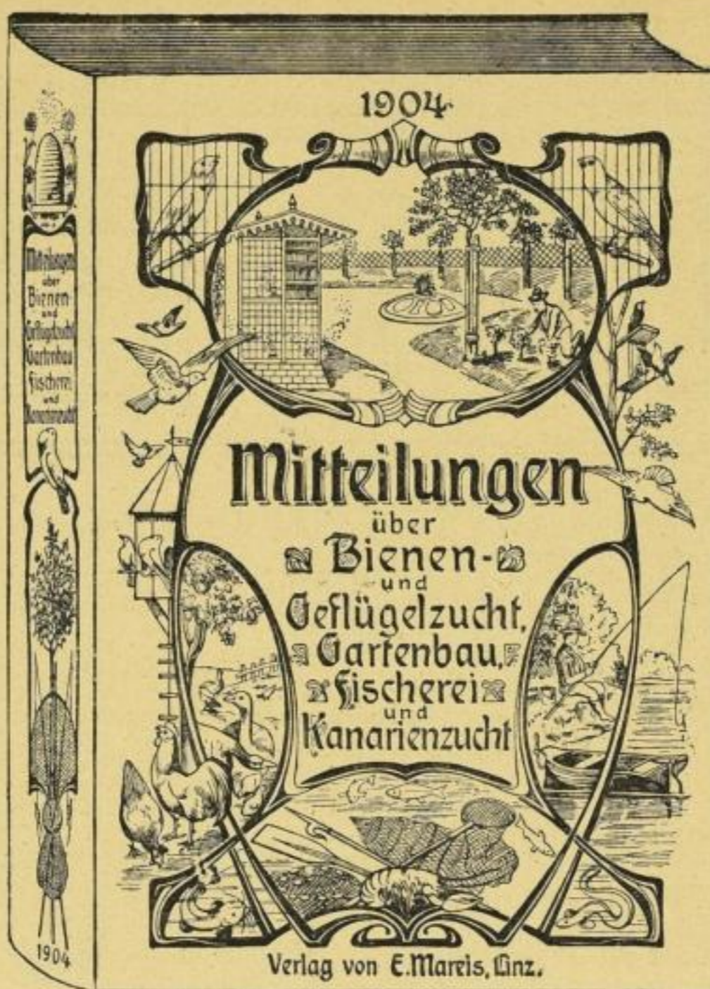
Reichhaltige Monatszeitschrift für jede ländliche Wirtschaft. Jahres-Abonnement nur 2 Mark.

Die Namhaftmachung von Adressen, welche sich für meine in 6000 Auflage erscheinenden