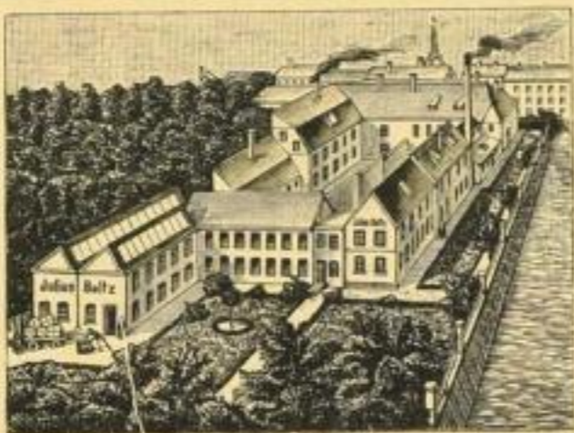
OOOOOO Gegründet 1841 OOOOOO

Julius Beltz, Langensalza Leistungsfähigstes Provinzdruckhaus mit großem Setzmaschinen-Betrieb