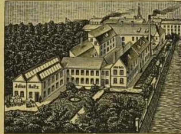
OOOOOO Gegründet 1841 OOOOOO

Julius Beltz, Langensalza Leistungsfähigstes Provinzdruckhaus mit großem Setzmaschinen-Betrieb