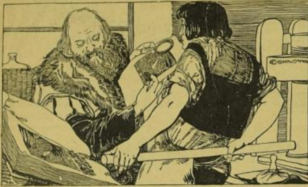
Druckerschrift: Congrat Wien.