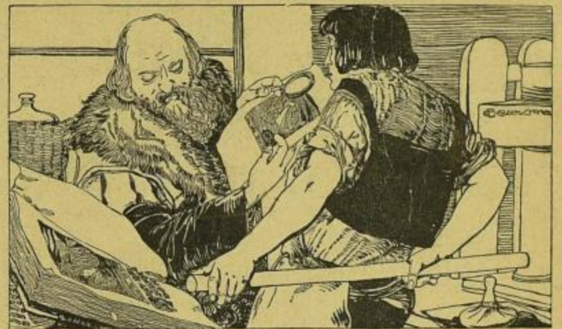
Drahtenschrift: Gangerer Wien.