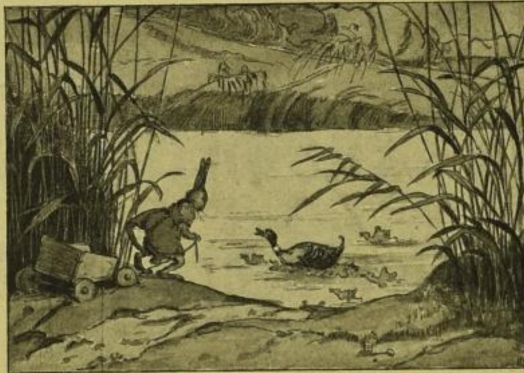
Illustrationsprobe. Original farbig.

Die farbigen Bilder von Luise Kumpa stehen in vollem Einklang mit den Märchen; sie sind ebenso reizend ausgeführt wie die Märchen erzählt sind.